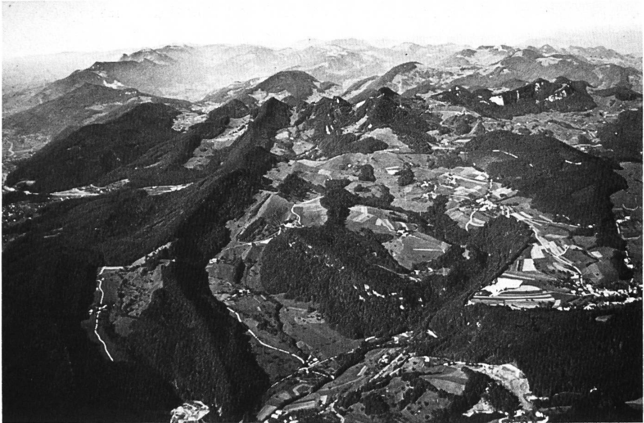
Bild 2. Unterer Hauenstein. Flugaufnahme von Hans Buser, 1970. Aufnahmeort: über der Frohburg. Im Vordergrund Südseite des Unteren Hauensteins mit den Ortschaften Hauenstein und Ifenthal. Hinter Ifenthal Ifleter Berg, Challhöchi und Belchenflue. Südliche Zugänge zum Chall: Weg durch den Oswald und von Ifenthal her.

anderen Ortschaften erwähnt wird 56 . Bevor Basel die Landschaft erworben und hier das Salzmonopol geltend gemacht hatte, bezog man vermutlich im ganzen Ergolzgebiet das Salz von Rheinfeldern 57 . Sogar nachdem Basel eidgenössisch und später reformiert geworden war, lieferte Rheinfeldern weiterhin Elsässer und Markgräfler Wein nach Sissach und Gelterkinden 58 .