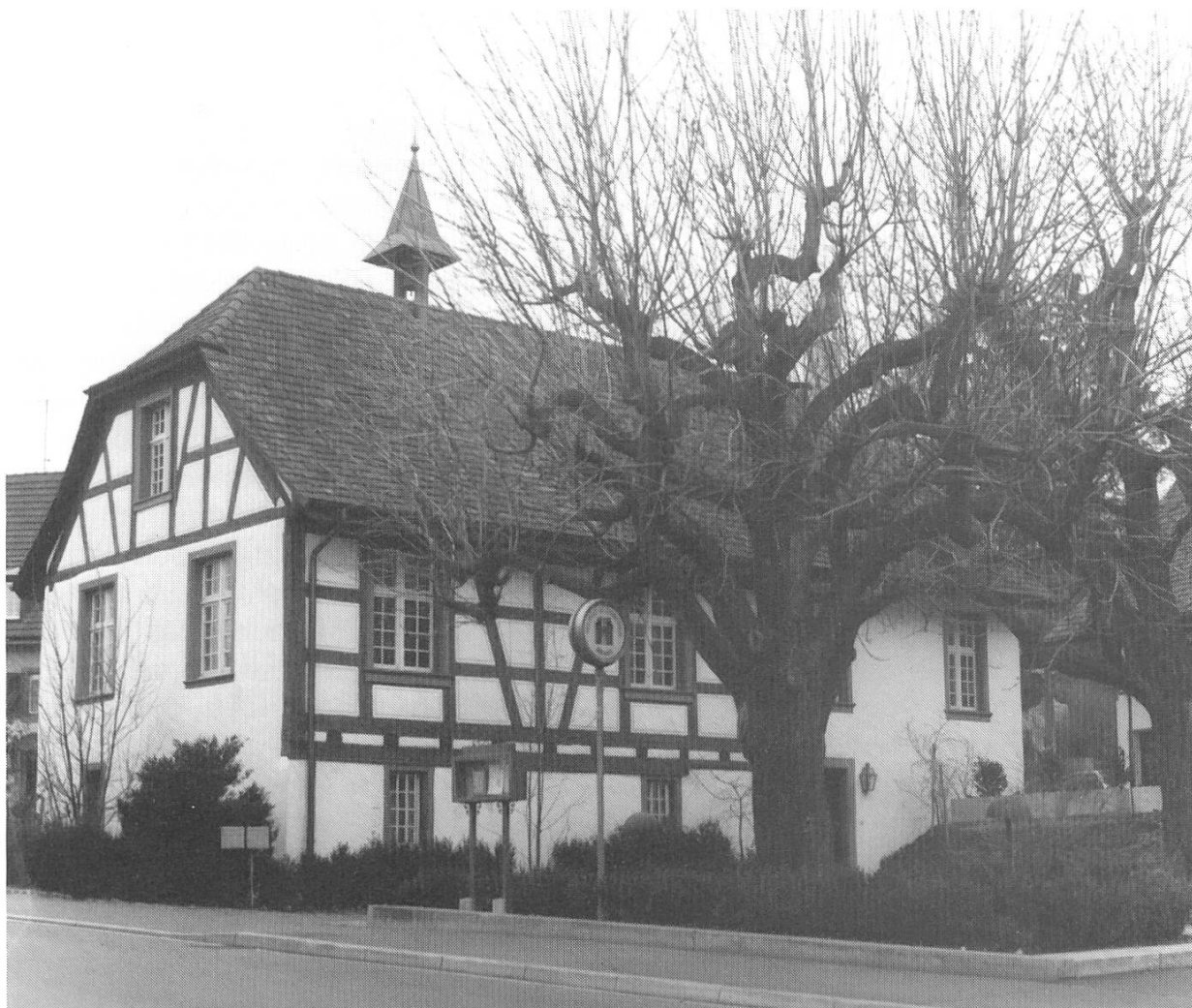
Bild 5. Begegnungszentrum Spritzehüsli heute.