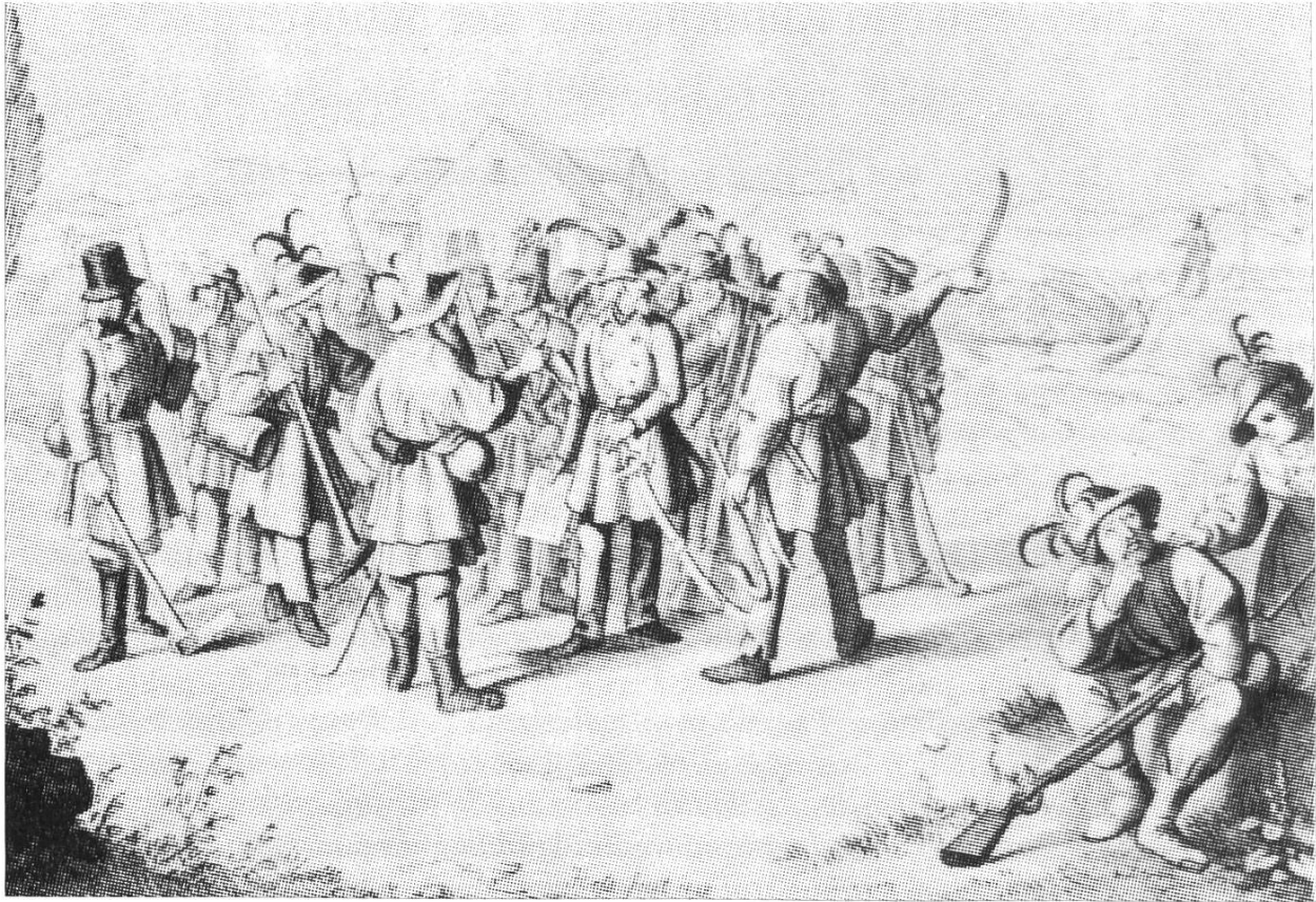
Bild 7. Badische Freischärler auf der Schusterinsel.

Die Freischaaren mussten aber von den anstrengenden Kämpfen und Märschen der letzten Tage so sehr erschöpft sein, dass sie die Aufstellung von Wachtposten gänzlich vernachlässigt hatten.