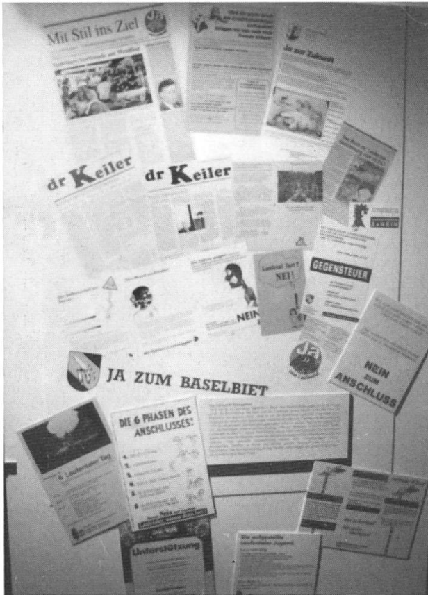
Auch die jüngste Geschichte des Laufentals wird in Originaldokumenten vorgestellt.

Ausstellungsmacher haben zahlreiche aktuellste Beiträge bekannter und lokaler Fachkräfte zusammengetragen und zu einer Publikation vereinigt. Historiker, Archäologen, Denkmalpfleger und Flurnamenforscher entwerfen ein ganz neues Bild von der Gründung und Entwicklung Laufens – und damit eine neue Ausgangsbasis für die nötige systematische und sachkundige Aufarbeitung der Stadtgeschichte.