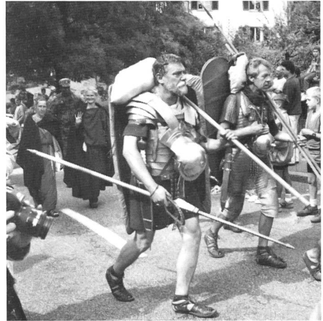
Einzug der Legionäre der «Legio VI Victrix» nach dem fast dreiwöchigen Marsch von Haldenstein GR nach Augusta Raurica.

Augusta Raurica nach 80 n. Chr. keine Grenzstadt mehr war und deshalb auf den Weiterbau grösserer fortifikatorischer Anlagen verzichtet wurde.