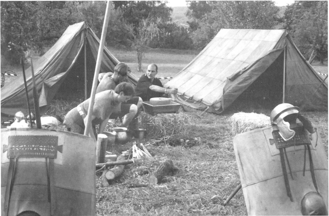
Vorbereiten des Nachtessens: Hafer wird an der Handmühle gemahlen und ein Feuer entfacht.