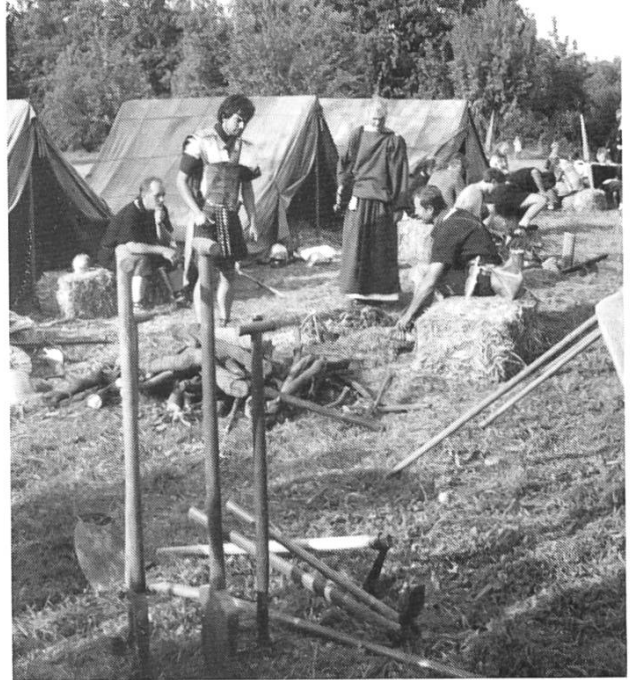
Lagerleben beim Forum: Nach dem Aufstellen der Zelte werden Werkzeuge geschärft, und man freut sich über Damenbesuch.