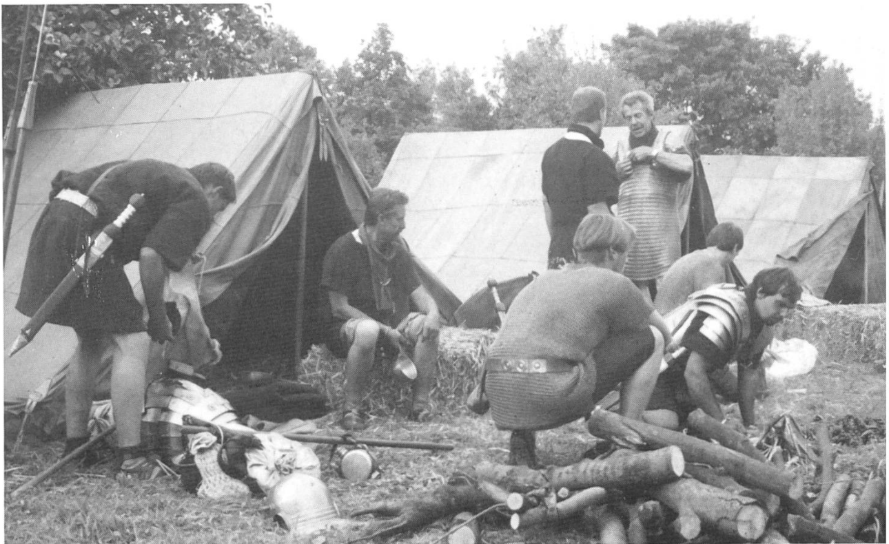
Das nach antiker Methode entfachte Feuer brennt: Das Nachtessen kann nicht mehr fern sein.