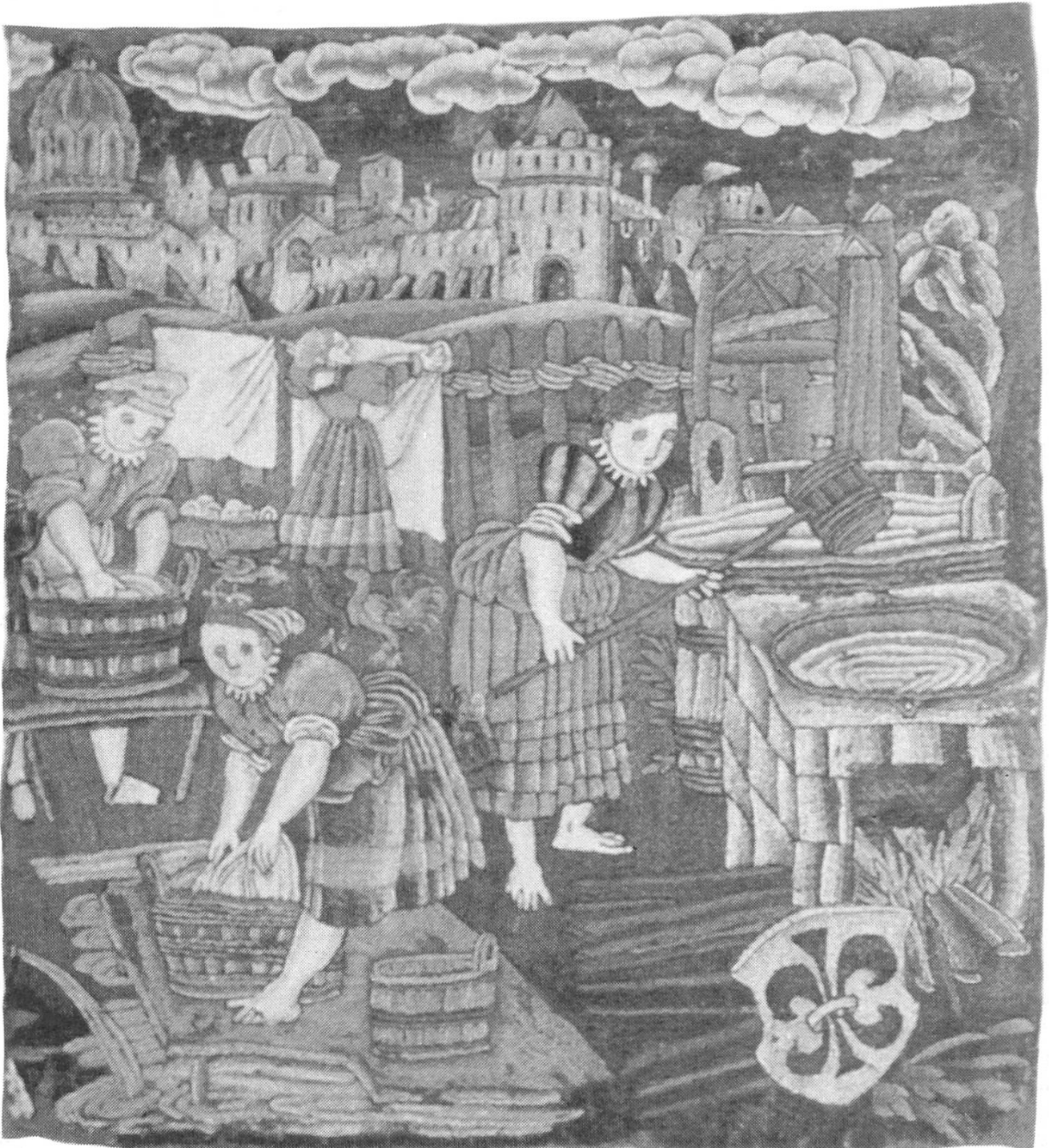
Eine Wollstickerei mit Wäscheszene, um 1580 (Schweizerisches Landesmuseum Zürich)

wandter Ort der Eidgenossenschaft, und zwischen Basel, Freiburg im Breisgau, Mulhouse, Colmar und kleineren Städten herrschten rege politische und wirtschaftliche Austauschbeziehungen. Der geographische Grossraum wird definiert