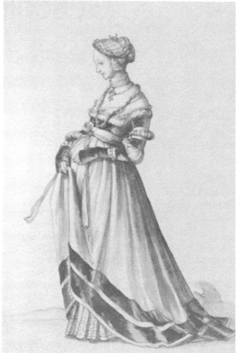
Hans Holbein d.J., um 1523 Adelige nach links schreitend (Öffentliche Kunstsammlung Basel, Kupferstichkabinett)

Die auf dem Umschlag abgebildete Waschszena auf einem bunten Wirkteppich im Landesmuseum Zürich führt gleich auf mehreren Ebenen mitten in die Thematik hinein: Wäsche waschen war zunächst eine harte, ausschliesslich weibliche Arbeit, die sich aus verschiedenen Arbeitsgängen zusammensetzte, und die mehrere Frauen gemeinsam verrichteten, seien es professionelle, eigens angestellte Wäscherinnen oder Frauen einer Familie. Die gemeinsame Arbeit im Waschhaus, wo die Frauen unter sich waren und "unkontrolliert" plauderten und Informationen austauschten, wurde jedoch von den Männern mit Misstrauen betrachtet. Dies führte zweitens dazu, dass Prediger zur Illustration der "Sünden des Mundes" auf die Wäscherinnen und das Waschhaus zurückgriffen,