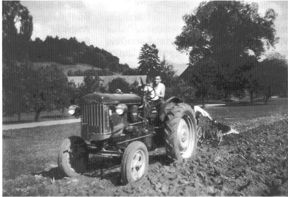
Der erste Traktor auf dem Schürhof, 1949.

schaft immer auch eine «Gleichzeitigkeit des Ungleichzeitigen» gab. So wurden auf gewissen Betrieben noch lange Pferde anstelle des Traktors oder neben diesem eingesetzt und die Anschaffung von Selbstladewagen oder Mistzettern rentierte sich für kleinere Betriebe oft nicht, so dass Bauern noch bis in die 1960er Jahre das Heu und Emd von Hand auf die Wagen verluden und den Mist mit der Gabel verstreuten.