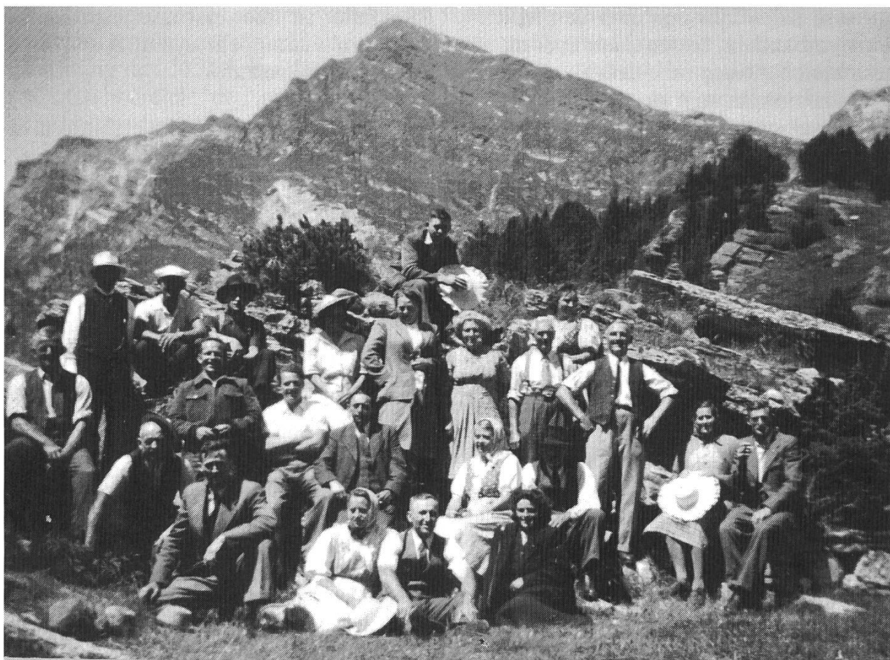
Gruppenbild von der Milchgenossenschaftsreise ins Tessin am 3. August 1949.

zerfall im Milchsektor hatten den regionalen Rahmen längst gesprengt.