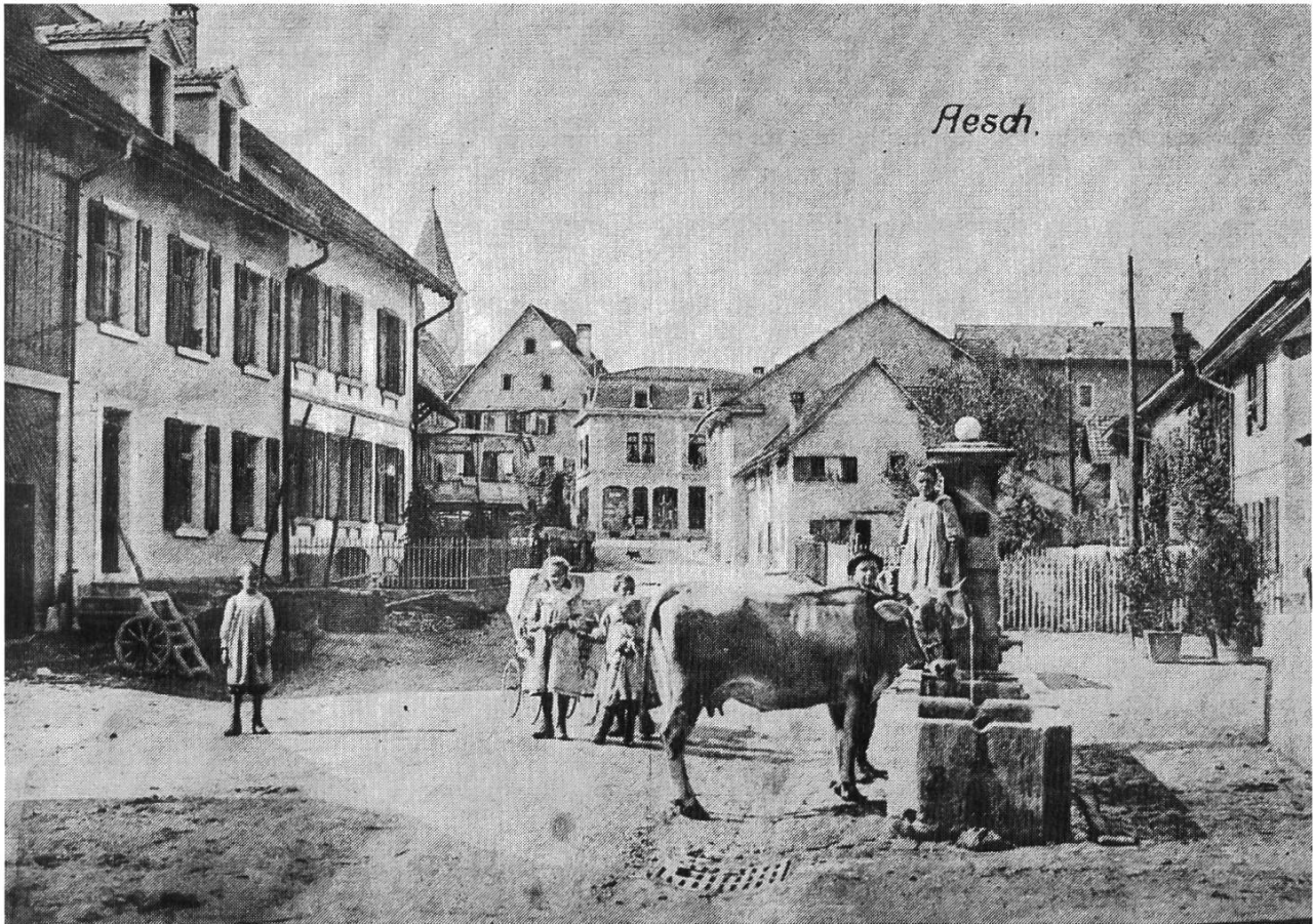
Ländliche Szene in der Bahnhofstrasse. Postkarte.

Als Brotgetreide diente vor allem Winter- und Sommerweizen; auf dorfnahen Feldern wurde auch etwas Dinkel angebaut, da dessen hartnäckiger Spelz etwas Schutz vor den Spatzen bot. Gerste, Roggen und Hafer dienten als Futtergetreide.