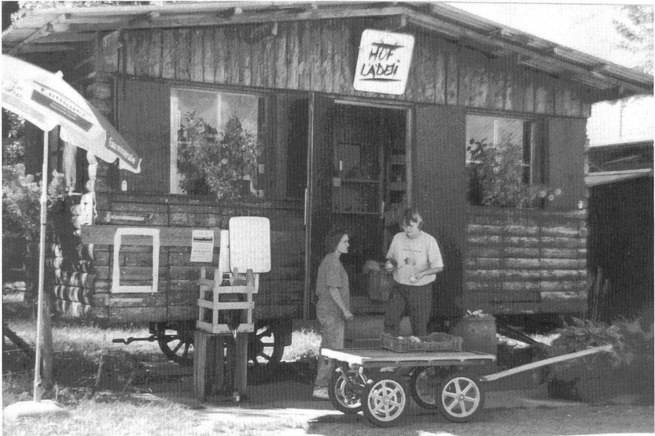
Das Hoflädeli dient der Direktvermarktung und bietet der Kundschaft Gelegenheit, direkt mit den Produzenten in Kontakt zu kommen.

dass ihnen hier eine jahreszeitlich sehr abwechslungsreiche, vielfältig gestaltete Landschaft frei zur Verfügung gestellt wird.