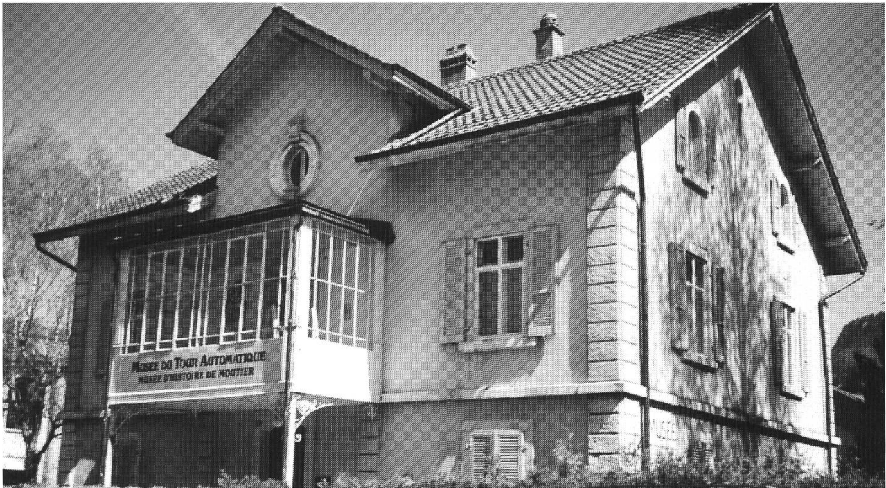
Das Drehautomatenmuseum in der ehemaligen Villa Junker in Moutier.