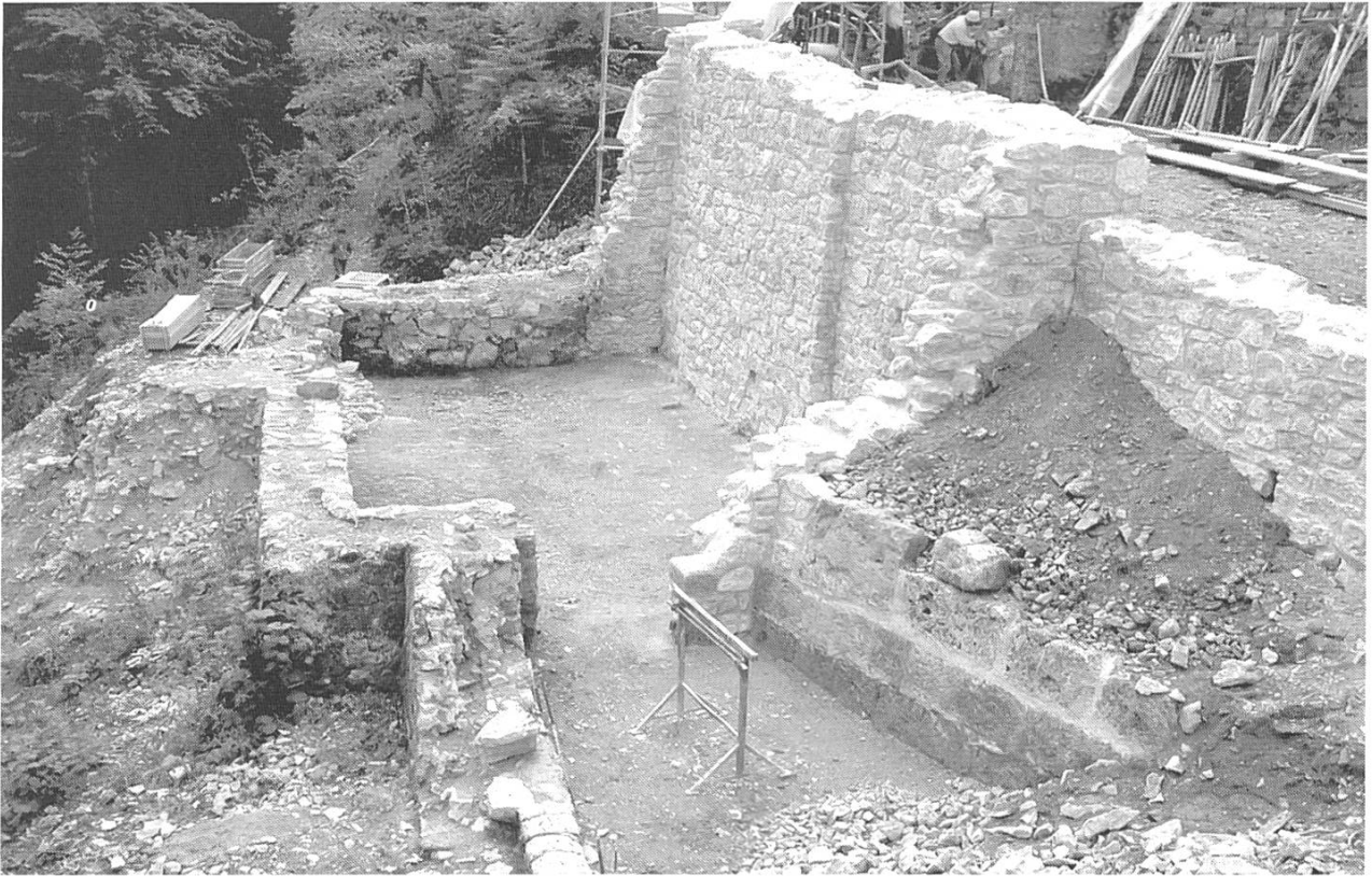
Abb. 5: Buus/Ormalingen/Hemmiken, Farnsburg. Der südöstliche Bereich der Burganlage nach der ersten Etappe der Sanierung. Teile des ehemaligen Wacht- und des Kornhauses wurden wieder neu aufgebaut.