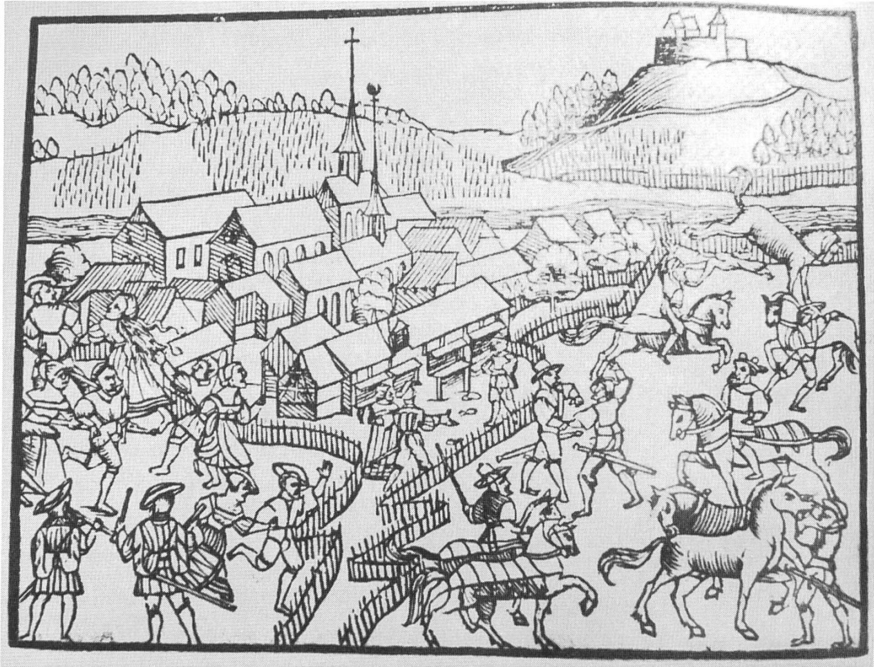
Spätmittelalterliches Dorf mit Etter in Form von Zäunen. (Aus: Rösener Werner: Bauern im Mittelalter. München 1991.)