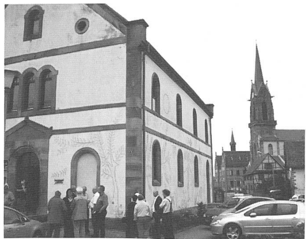
Der jüdische Friedhof und die Synagoge von Mackenheim. Letztere entstand 1867, ein Jahr nach der nahe liegenden Kirche.

Geschichte ist in Arbeit – voraussichtliche Veröffentlichung 2009.