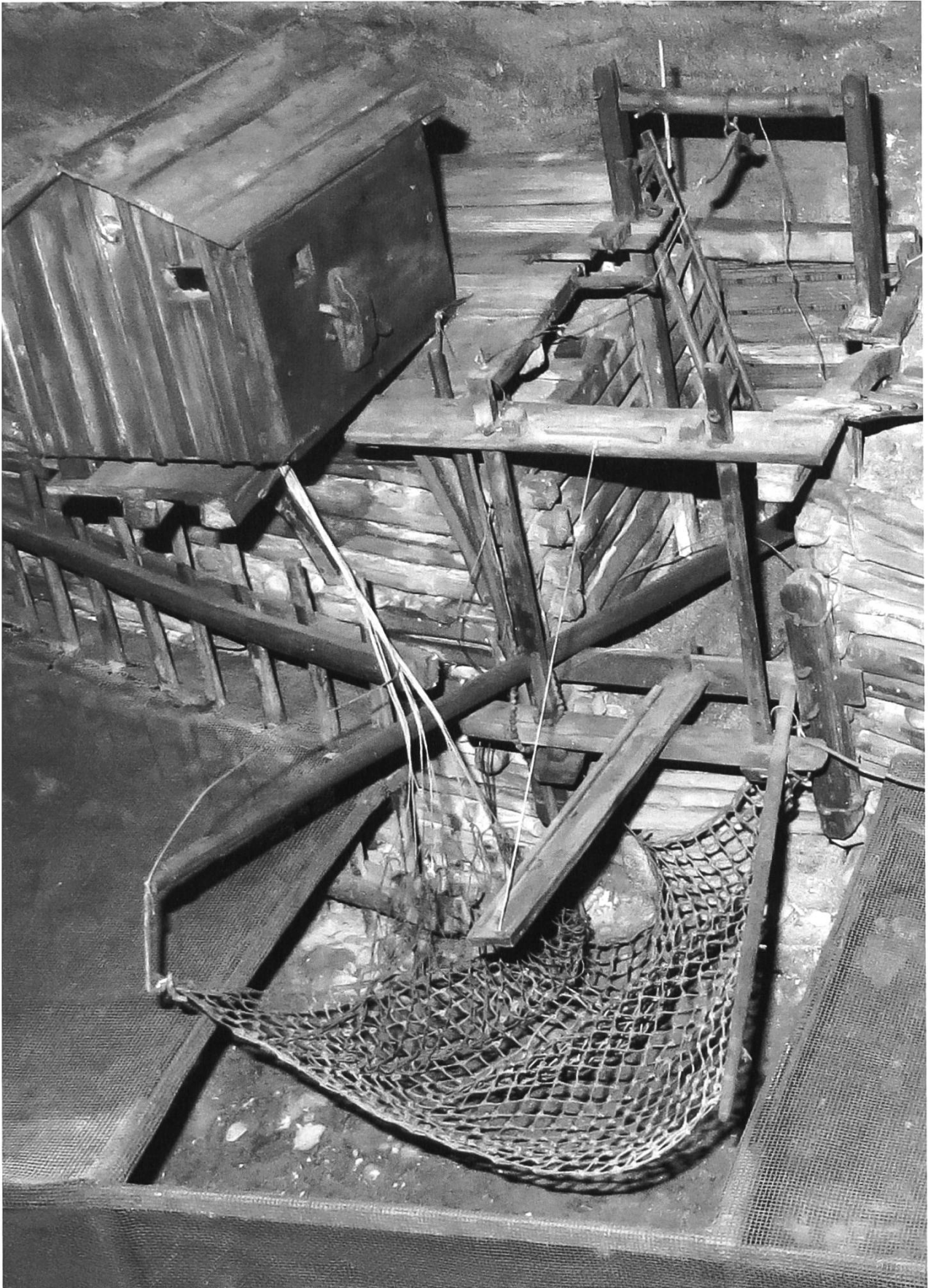
Modell einer Basler Salmenwaage (Sammlung Museum der Kulturen; Objektfoto D. Wunderlin).