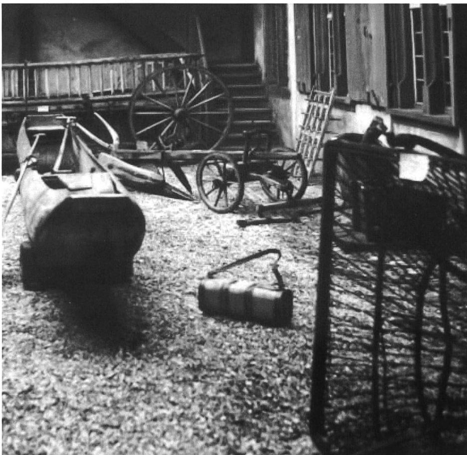
In der Ausstellung «Volkskunde und Volkskunst» von 1910 wurden im Innenhof des Rollerhofs am Münsterplatz auch der Einbaum vom Ägerisee und die Reuse von Laufenburg gezeigt.