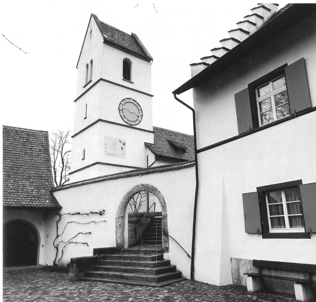
Abb. 1: Die Dorfkirche St. Nikolaus von Oltingen mit dem Pfarrhaus.

Wir haben es alle schon erlebt: Ein grösserer Verein oder eine Organisation tagt in einer Ortschaft. Zu einem Grusswort ist auch der Gemeindepräsident oder die Gemeindepräsidentin eingeladen, wobei es dann natürlich nicht selten ist, dass die Gemeinde sich als grosszügige Gastgeberin gibt, indem sie den Versammlungsort kostenlos zur Verfügung stellt oder einen Apéro mit Knabberzeug oder den Kaffee mit Gipfeli offeriert.