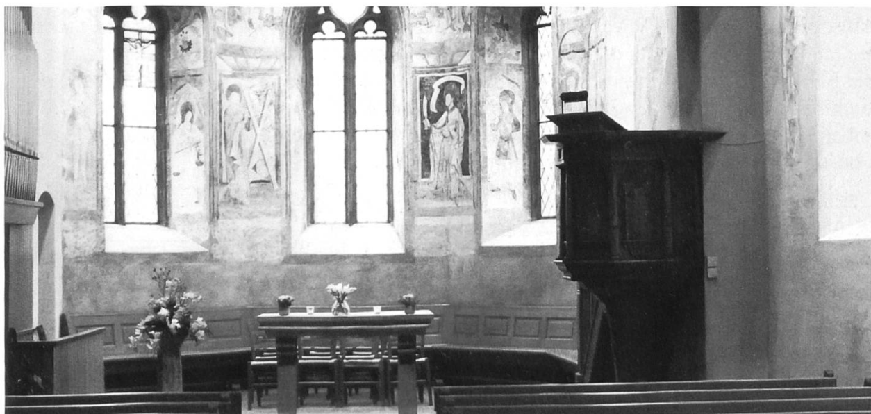
Abb. 3: Dass die Nikolauskirche ein Kleinod ist, zeigt hier der Freskenschmuck im gotischen Chor.