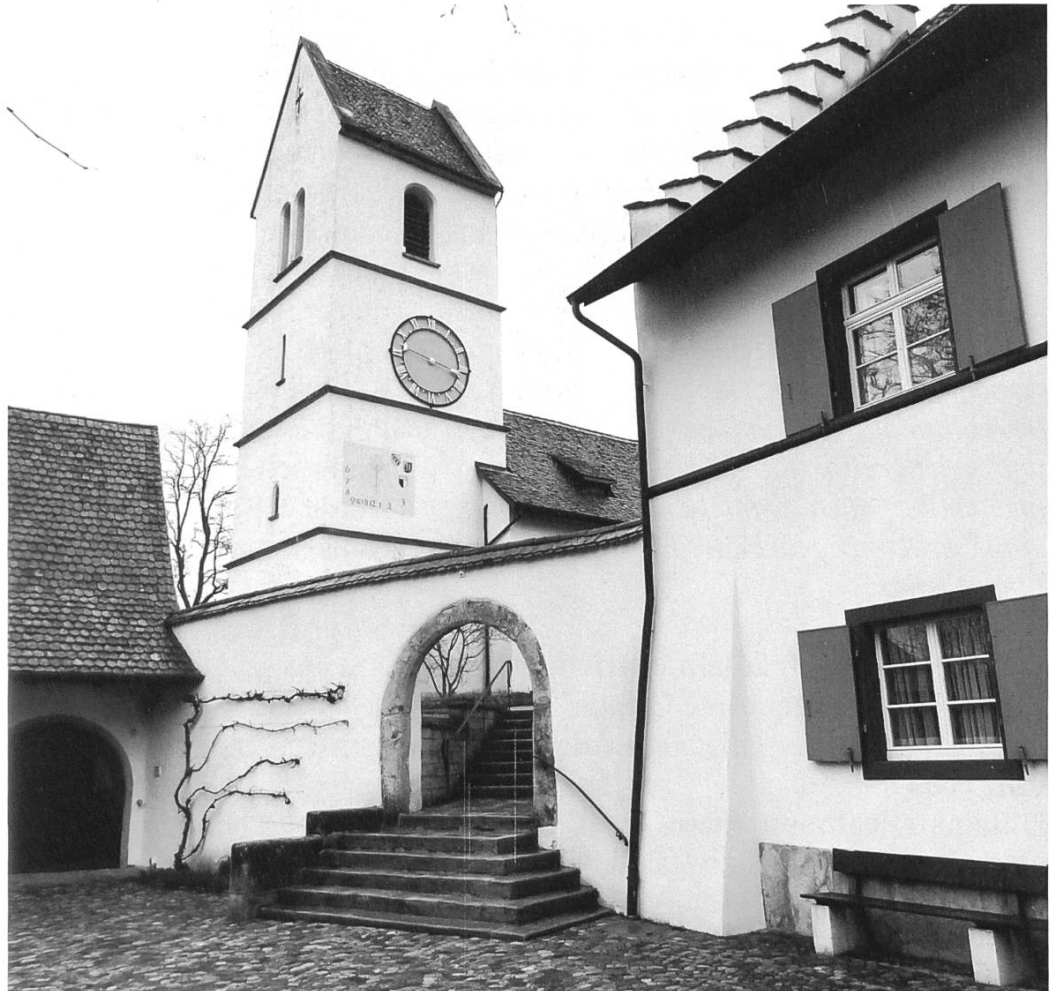
Abb. 1: Die Dorfkirche St. Nikolaus von Oltingen mit dem Pfarrhaus.

Wir haben es alle schon erlebt: Ein grösserer Verein oder eine Organisation tagt in einer Ortschaft. Zu einem Grusswort ist auch der Gemeindepräsident oder die Gemeindepräsidentin eingeladen, wobei es dann natürlich nicht selten ist, dass die Gemeinde sich als grosszügige Gastgeberin gibt, indem sie den Versammlungsort kostenlos zur Verfügung stellt oder einen Apéro mit Knabberzeug oder den Kaffee mit Gipfeli offeriert.