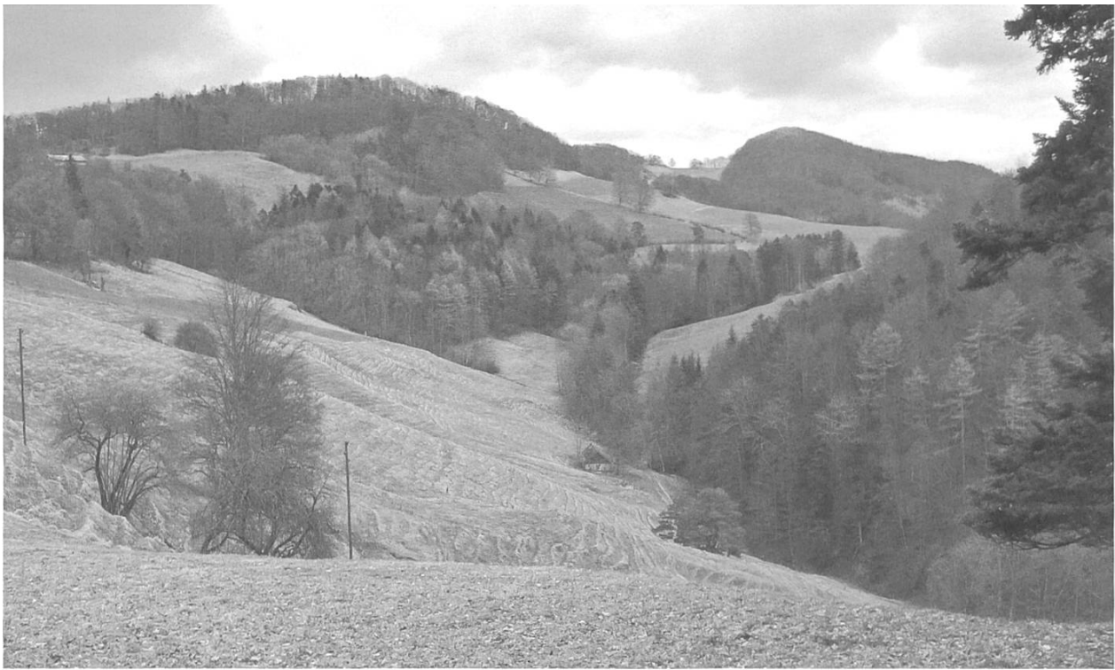
Der Name ist hier Programm: Schönthal.

Aufgabe des Klosters während der Reformation, Schönthaler Geistliche sonn- und feiertags den Weg nach Bennwil resp. Titterten unter die Füße nehmen mussten.