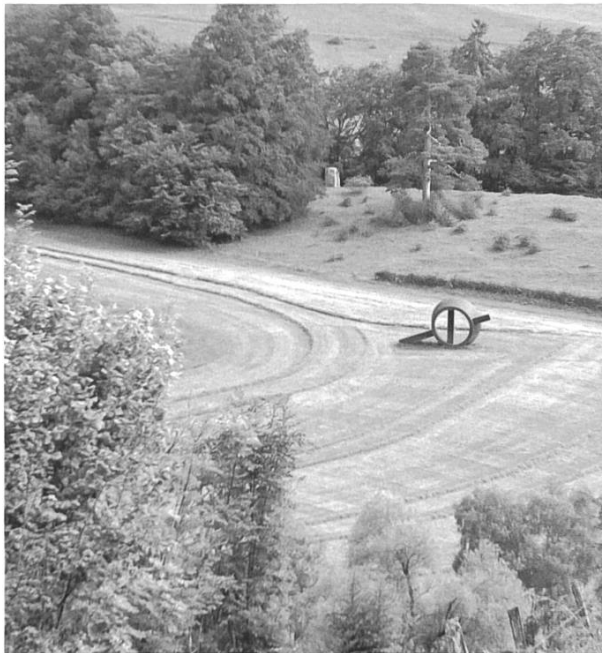
Die Skulptur Soglio von Nigel Hall und die Bewirtschaftung der Umgebung ergänzen sich hier auf eine eindruckliche Weise.

Nach dem Besuch des Spitteler-Denkmals und der Kirche geht es in Richtung Dielenberg. Beachtenswert sind die weitgehend in ihrer ursprünglichen Form erhaltenen Bauernhäuser