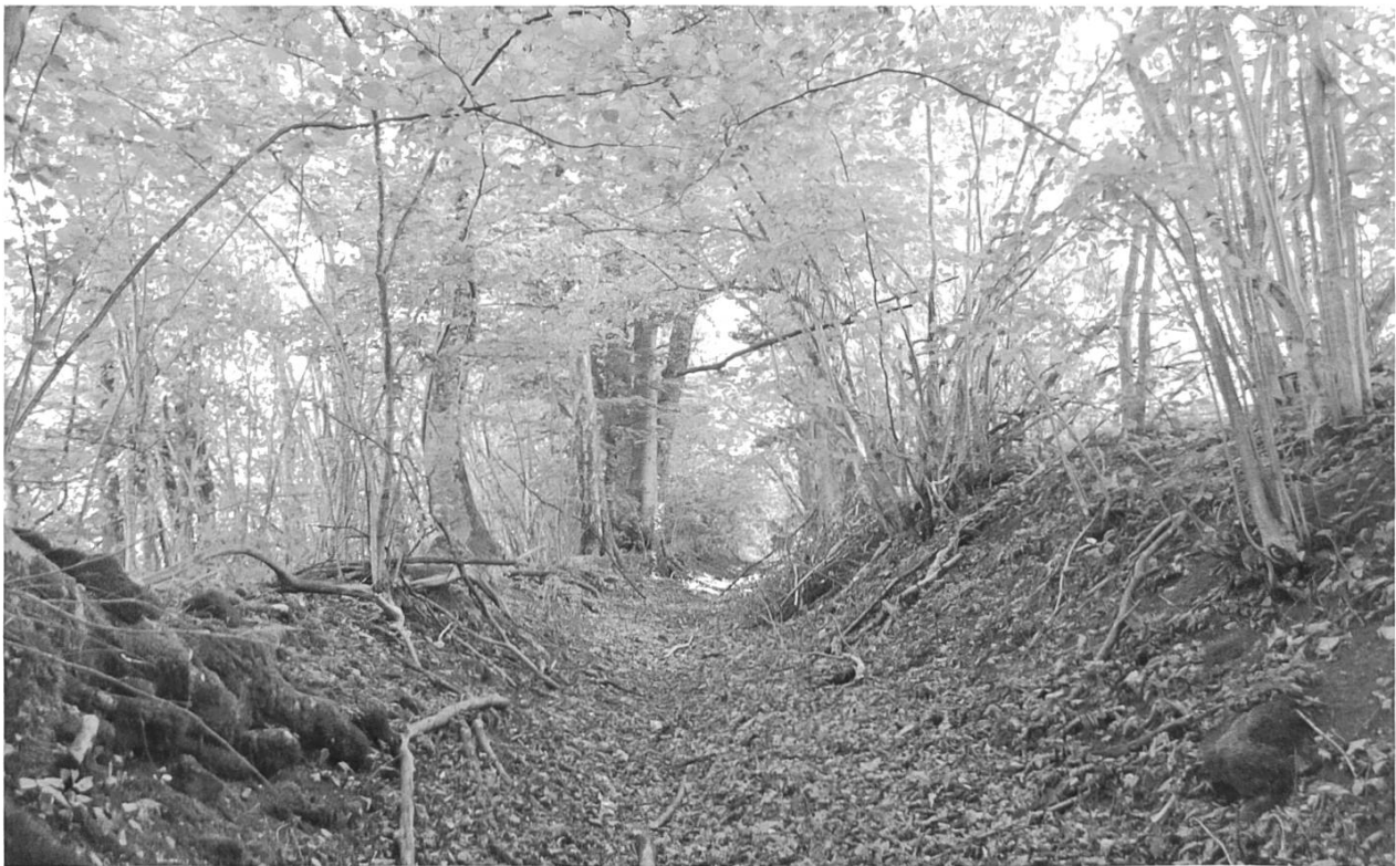
Der Hohlweg durch die Flur Ried.

Als 1189 der Froburgische Graf Hermann II. einem Enkel des Stifters Graf Ludwig die Patronatsrechte der Kirchen von Bennwil und Titterten übertrug, war damit auch die seelsorgerische Betreuung der Gemeinden verbunden. Es muss somit davon ausgegangen werden, dass vom 12. Jahrhundert an, mit Unterbrüchen, als das Haus ein reines Frauenkloster war, bis zur endgültigen