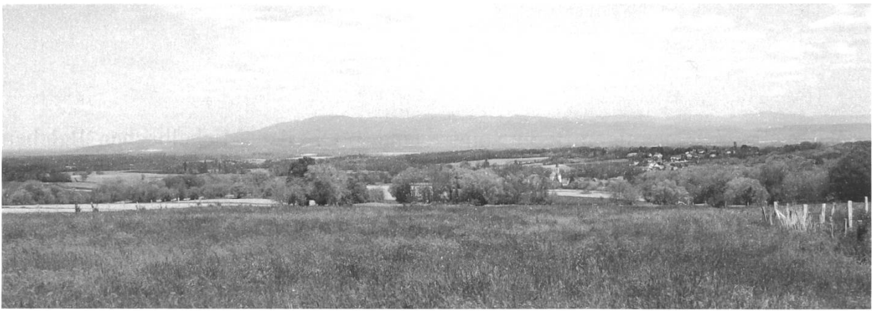
Abb. 2: Blick vom Landgut St-Apollinaire in den Schwarzwald.

benannt worden wären, der zu den fraglichen Berggipfeln in keine Beziehung zu bringen ist. 13