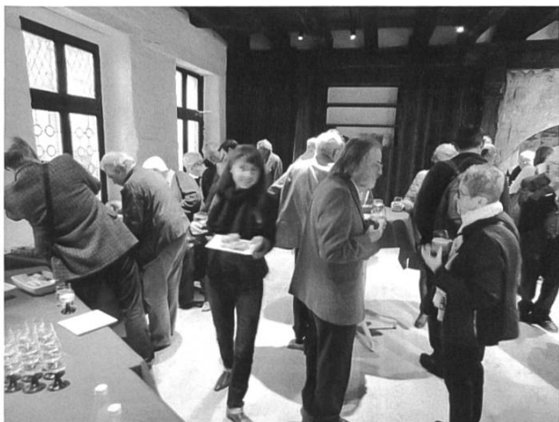
Grenzüberschreitende Kontakte beim Mittagessen am Kolloquium des Netzwerks Geschichtsvereine in Sélestat.