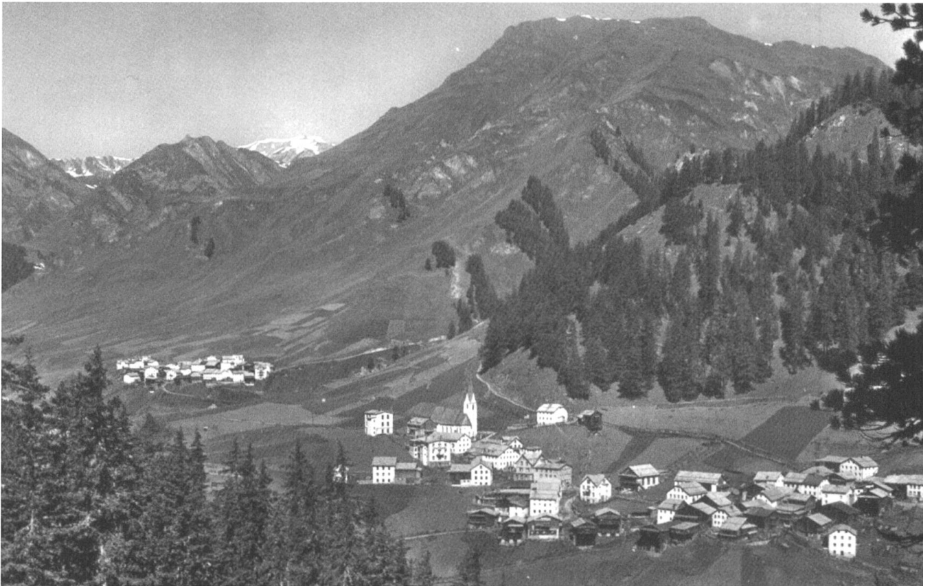
Samnaun-Compatsch (oben), Samnaun-Dorf (unten). Bilder von der DVD «Samnaun in Bildern, ca. 1900–2010», hg. von der Gemeinde Samnaun. Das Aufnahmedatum der Bilder ist leider nicht bekannt.