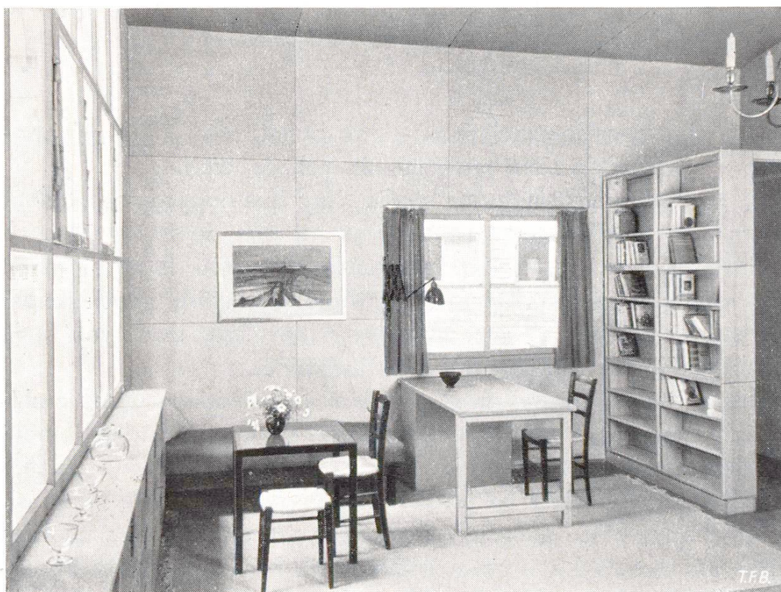
Fig. 3 Revêtements et ameublement en bois suisse

Maison moderne en béton armé pour l'équipement intérieur de laquelle on a fait un large usage du bois.