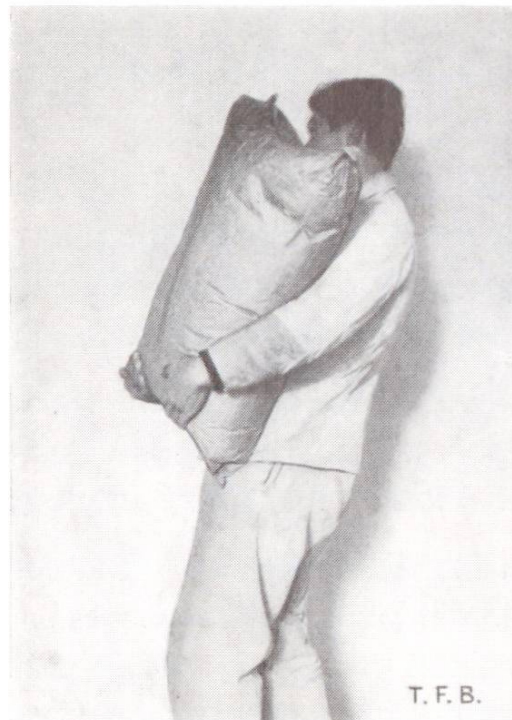
Fig. 3 Les sacs de ciment ne doivent pas être portés ainsi, mais comme cela

La détérioration du ciment et l'avilissement progressif de sa qualité se produisent plus ou moins vite selon les conditions d'entreposage. Sa durabilité sera donc variable.