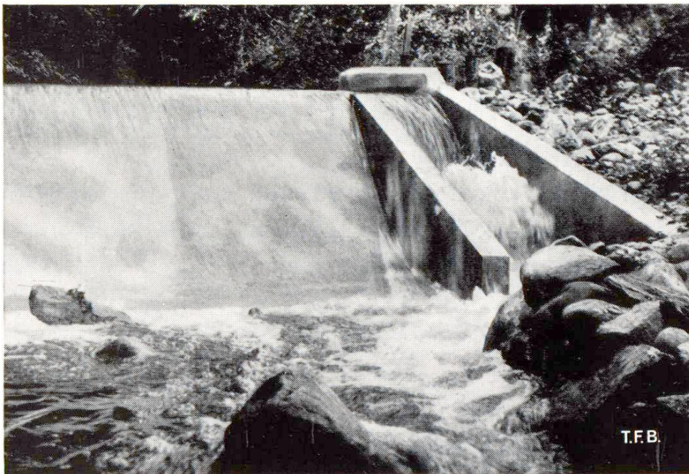
Fig. 1 Les liants hydrauliques doivent posséder la plus grande résistance possible à l'action mécanique et dissolvante de l'eau

Tandis que les ciments et la chaux hydraulique durcissent convenablement à l'air lorsqu'on ne les prive pas prématurément de l'humidité nécessaire au durcissement et qu'ils sont donc utilisables pour tous les ouvrages à l'air , les liants composés (ciment à gangues hydrauliques), constitués par des pouzzolanes ne possèdent pas cette propriété au même degré, car ils ont tendance à se fissurer sous l'influence du retrait (réseau superficiel de fissures). On ne peut donc pas les employer universellement comme les autres liants. De ce fait, ils ont perdu l'importance qu'ils avaient dans le temps et ne jouent plus aujourd'hui qu'un rôle historique.