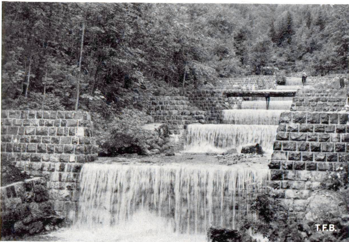
Fig. 2 Barrages en maçonnerie de pierres naturelles jointoyées au mortier de ciment portland. Correction du Dürrenbach, Stein, Toggenburg

L'érosion profonde causée par les torrents à forte pente est combattue en anéantissant d'une manière inoffensive l'énergie , c'est-à-dire le pouvoir destructif de l'eau et en relevant les lits profondément encaissés pour donner de nouveau une base aux rives abruptes et favoriser la formation d'un talus naturel stable.