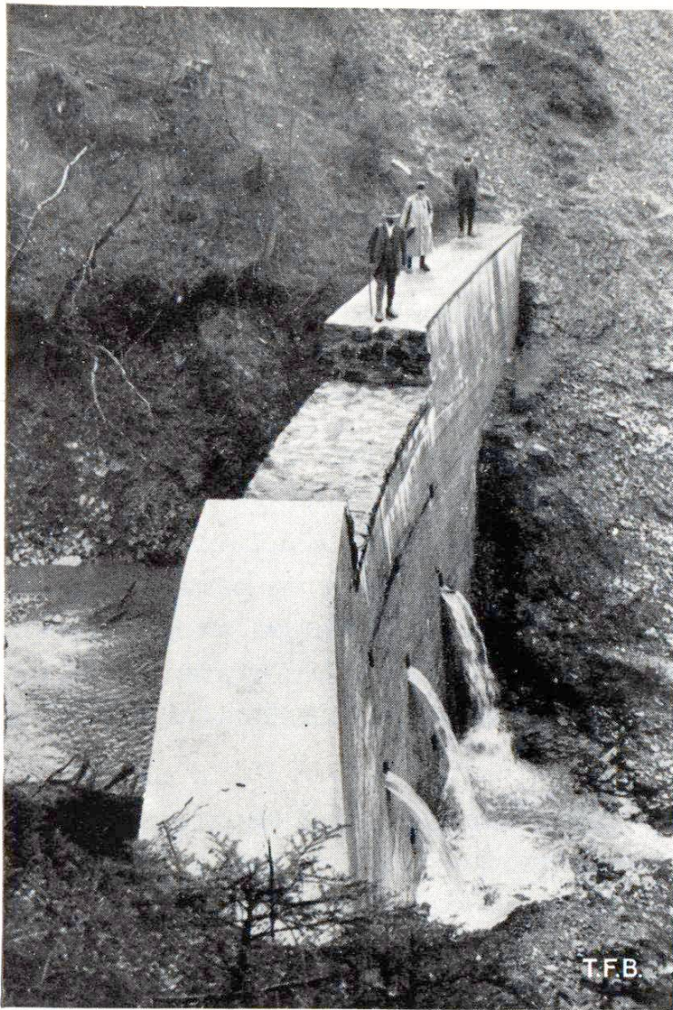
Fig. 5 Barrage en béton à déversoir revêtu de pierres naturelles, peu après l'achèvement de la construction. Aujourd'hui rempli de matériaux de charriage à l'amont. Trübbach près de Trübbach, canton de St. Gall

cuter des barrages en maçonnerie, il faut tenir compte du fait que ces ouvrages sont constamment soumis à l'influence de l'humidité naturelle des masses de terres situées côté amont et sur les versants, qu'ils subissent l'effet de variations de température brusques et répétées, en particulier à haute altitude et que, par conséquent, ils doivent supporter l'action déterminante du gel. Pour que ces ouvrages résistent à l'épreuve du temps, il faut donc qu'ils répondent (dans la mesure où leur durée dépend des qualités de la maçonnerie) aux exigences familières à l'ingénieur et qui sont: emploi de pierres naturelles résistant aux intempéries, fabrication de béton suffisamment dosé et dense, à agrégats convenables et eau de gâchage ne contenant aucune matière nuisible au ciment, surveillance adéquate des travaux d'exécution.