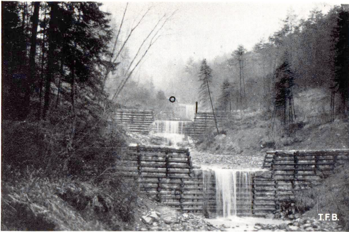
Fig. 1 Barrages en bois remplis de pierres sur le Widenbach, Altstätten

L'érosion profonde causée par les torrents à forte pente est combattue en anéantissant d'une manière inoffensive l'énergie , c'est-à-dire le pouvoir destructif de l'eau et en relevant les lits profondément encaissés pour donner de nouveau une base aux rives abruptes et favoriser la formation d'un talus naturel stable.