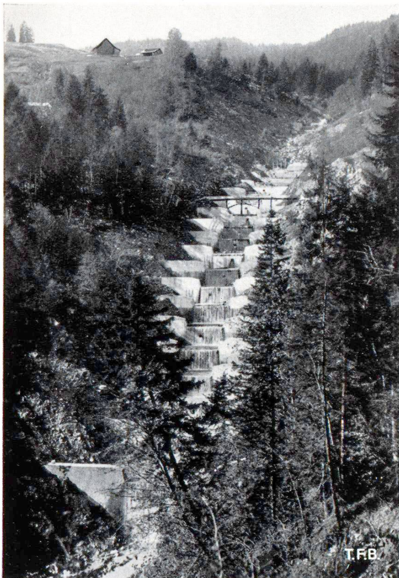
Fig. 6 Escalier de barrages en béton à déversoirs revêtus de pierres naturelles. Mettenlauri à Giswil, Obwald. Vue prise en 1934. Aujourd'hui les berges du torrent sont entièrement recouvertes de buissons et de jeunes arbres.

culier, de l'étroite collaboration des ingénieurs civils et des représentants de l'agriculture et de l'administration forestière. A la montagne, les résultats obtenus se bornent en général à la protection et à la conservation des terrains menacés tandis que dans le bas l'investissement de capitaux importants se justifie le plus souvent par un gain de terre cultivable ou par un meilleur rendement du sol. Considérées au point de vue national, les corrections de torrents sont très importantes car elles permettent d' assurer l'existence aussi bien des populations rurales de nos vallées que celle des paysans de nos montagnes .