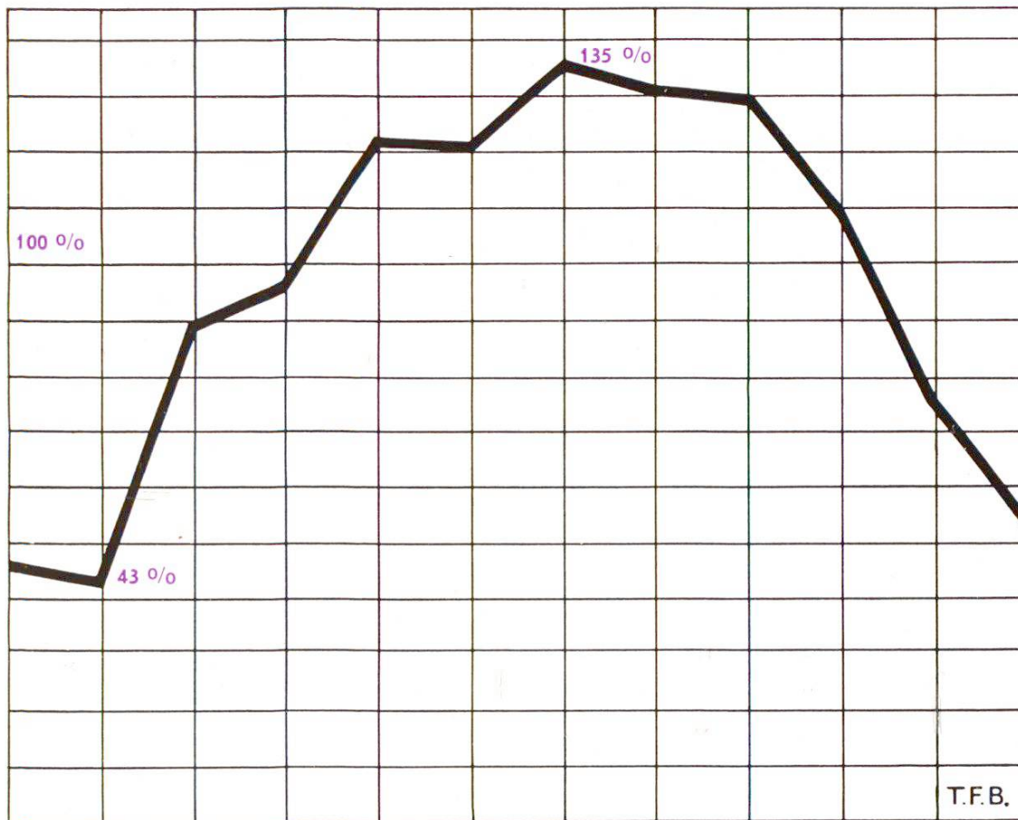
Jan. Fév. Mars Avril Mai Juin Juillet Août Sept. Oct. Nov. Déc. Variations mensuelles de la consommation du ciment (Moyenne mensuelle = 100)

Chaque fabrique procédant chaque jour à la mouture d'une grande quantité de ciment (des centaines de tonnes pour certaines d'entre elles), on comprend qu'il soit pratiquement excessivement difficile de refroidir complètement une telle masse de matière à faible conductibilité thermique. L'industrie s'est pourtant préoccupée depuis longtemps de ce problème, mais malgré des essais nombreux et coûteux, elle n'est pas arrivée à des résultats complets, car on est toujours arrêté par l'obligation de limiter les contacts entre le ciment et l'air chargé d'humidité et d'acide carbonique.