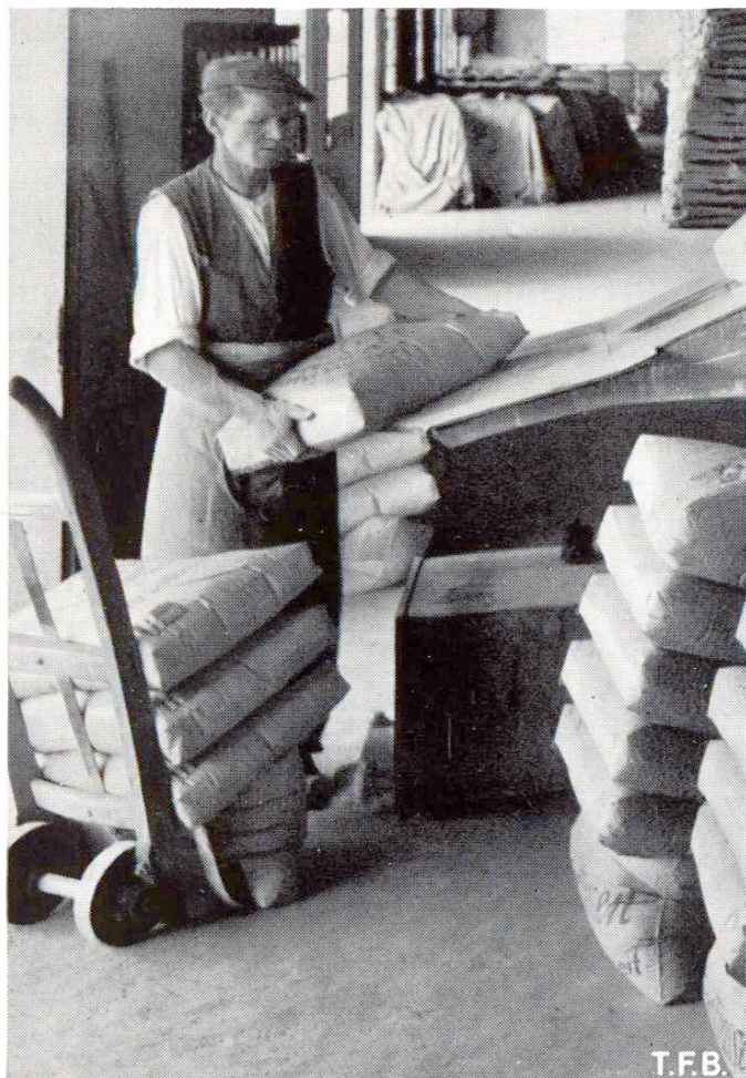
Transport de sacs de ciment au moyen d'un diable

Il en est de même du durcissement du béton. La température élevée du ciment et de l'air contribuent toutes deux à une augmentation plus rapide des résistances, sans que d'ailleurs l'allure de cette augmentation ait une influence quelconque sur les résistances finales.