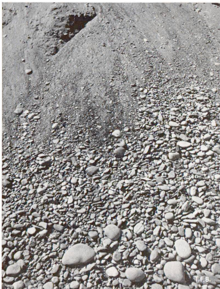
Fig. 1 Ségrégation dans un dépôt de sable et gravier mal constitué. Le prélèvement sans discernement des matériaux de ce dépôt donnerait un béton de granulométrie déplorable et très irrégulière.

Le phénomène de la ségrégation des matériaux granulés. Inconvénients de la ségrégation du béton. Tendance à la ségrégation des différents types de béton. Mesures propres à limiter la ségrégation du béton.