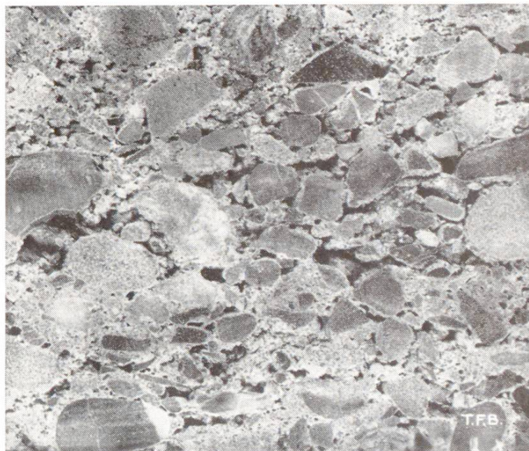
Fig. 4 Nids de gravier formés par la chute du béton d'une hauteur trop grande.

Les différents types de béton n'ont pas tous la même tendance à la ségrégation. Les mélanges trop fluides ou trop secs y sont plus enclins que ceux qui ont une consistance convenable et la présence de trop gros éléments dans le béton facilite encore le phénomène. Les mélanges à granulométrie discontinue sont tout particulièrement portés à la ségrégation qu'on ne peut pratiquement pas empêcher quand ce sont les grains moyens qui manquent.