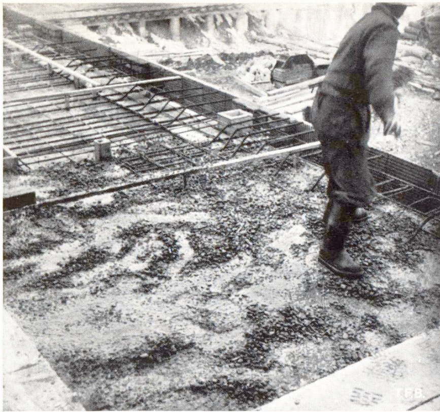
Fig. 5 Forte ségrégation dans un béton li- quide.

Comme on l'a vu plus haut, la ségrégation est la conséquence de mouvements rapides du mélange. Pour le béton frais, cela peut se produire dans les cas suivants: