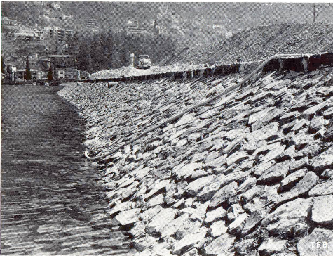
Fig. 6 Le talus revêtu de pierres à joints fortement creux s'inscrit agréablement dans le paysage.

spécial, puis transporté par des tuyaux, sous l'action de la grosse pompe jusqu'au réservoir mobile placé au voisinage du talus. La pompe secondaire et des tuyaux souples permettent ensuite de le conduire à pied d'œuvre et de le couler à l'endroit préparé à cet effet.