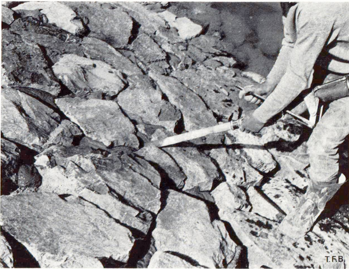
Fig. 3 Injection hors de l'eau.

d'excavation du tunnel dont les interstices furent colmatés et jointoyés au mortier ordinaire et matériaux d'excavation du tunnel avec injection et colmatage des vides au mortier colloïdal.