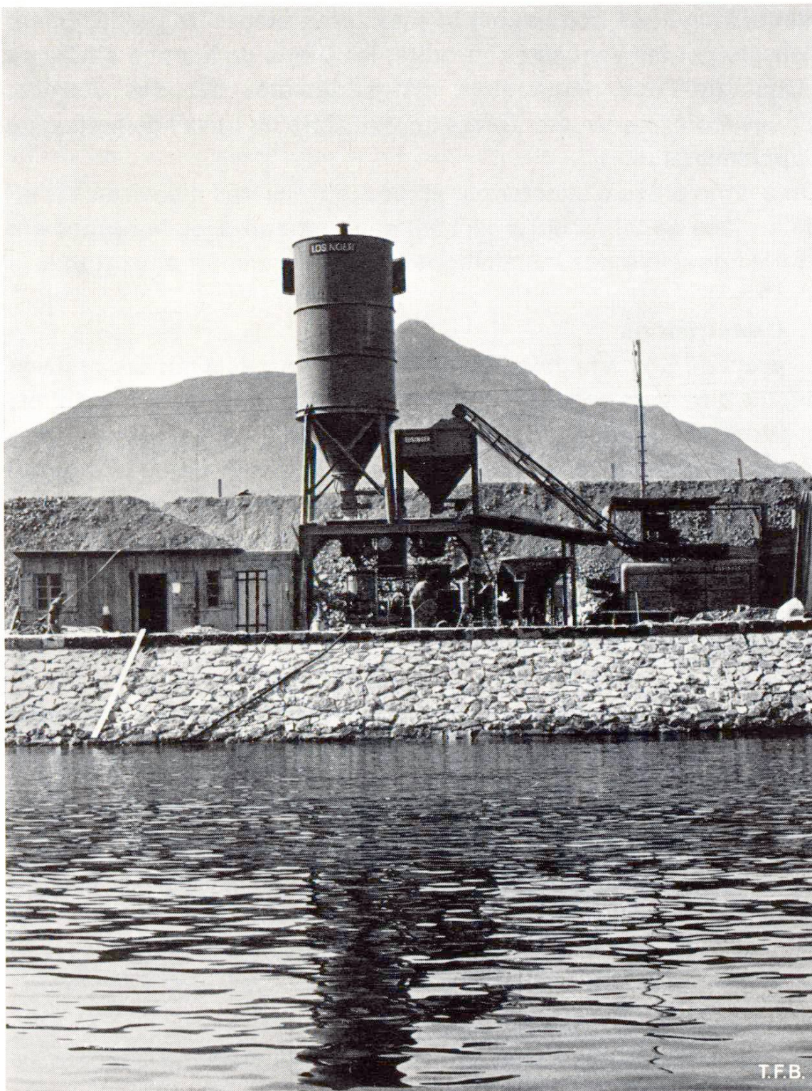
Fig. 2 Installation pour la préparation du mortier Colcrete avec malaxeur spécial de 350 l.

Les trois modes de faire suivants ont fait l'objet d'essais: Eléments préfabriqués en béton constitué de granulats de gravière, matériaux