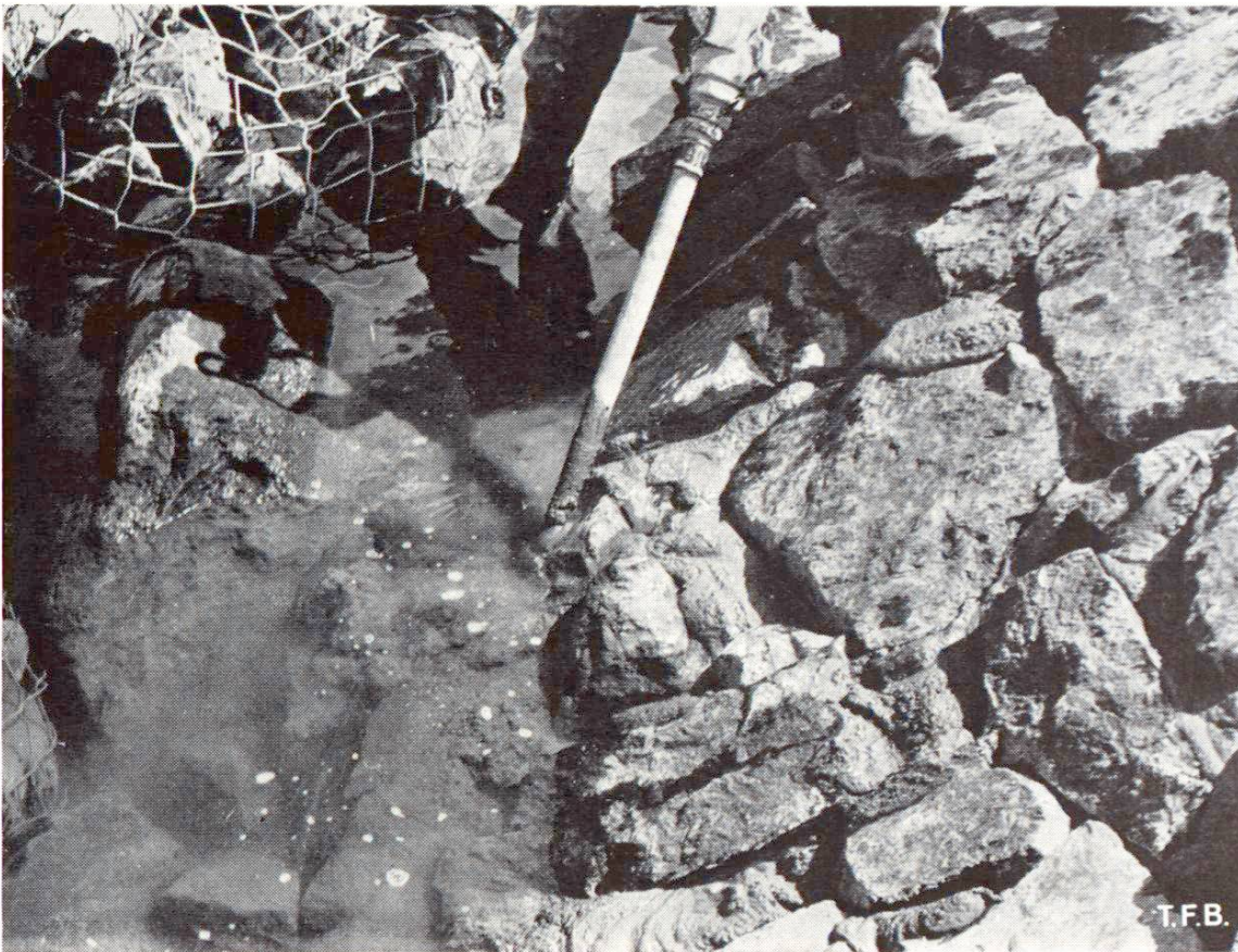
Fig. 4 Injection sous leau.

à ce procédé d'être sensiblement meilleur marché que ceux qui lui étaient comparés.