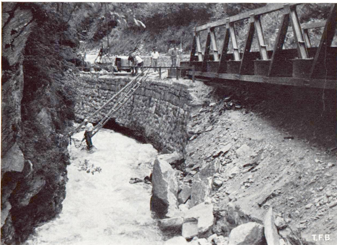
Fig. 3 Mur de soutènement dont la fondation a été affouillée.

L'enveloppe vide, en forme de manche souple, est placée sur l'eau et amarrée à la rive. L'injection commence et l'enveloppe s'enfonce sous l'eau en même temps qu'on relâche le câble d'amarrage. Le container encore plastique s'adapte progressivement et grâce à son poids s'applique parfaitement dans les cavités du lit. Les pierres en saillie, rondes ou anguleuses sont en général très bien enveloppées, sans qu'il se produise de déchirure du tissu. Des containers placés côte à côte s'appliquent l'un à l'autre sans qu'il reste de vide entre eux.