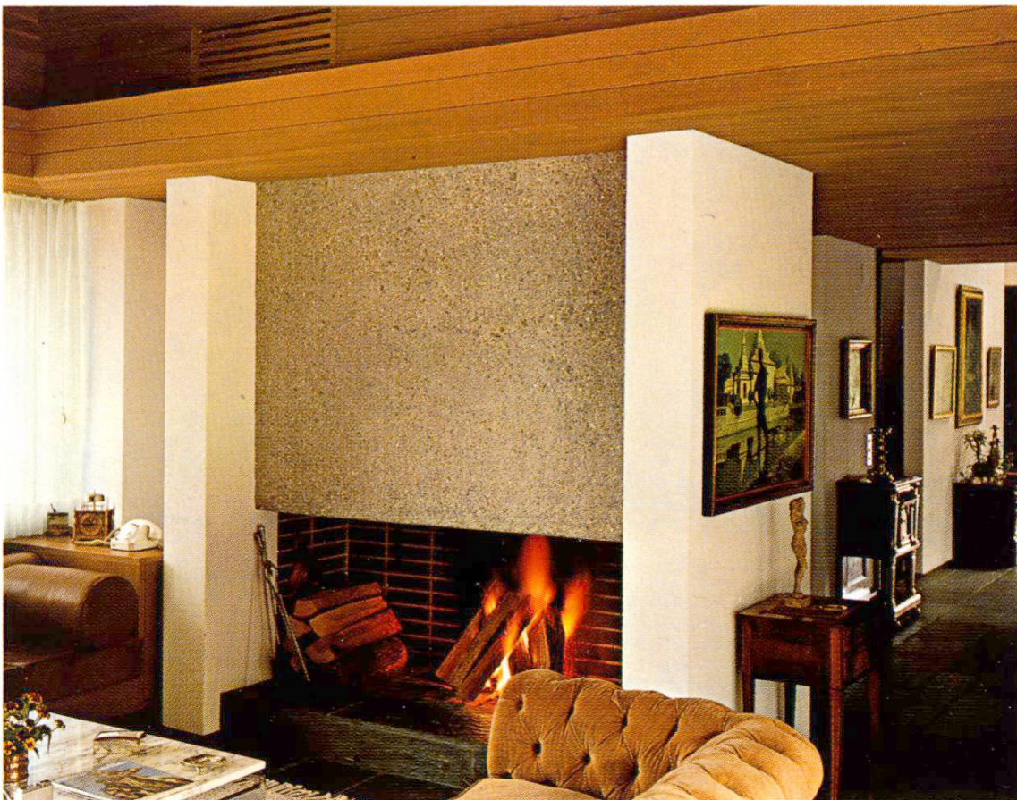
Dans le salon, cheminée avec manteau en béton apparent.

Des essais avec différentes teintes et différents modes de travail ont été exécutés sur les murs des caves. Cela permit aussi de familiariser l'équipe avec les particularités de cette construction. Le coût du bouchardage dépend beaucoup du moment où le travail est exécuté. En moyenne, il est de l'ordre de grandeur de celui d'un bon enduit tri-couches. Le coût de la coloration est, par mètre carré, environ le dixième de celui du bouchardage, et par conséquent inférieur à celui de n'importe quelle bonne peinture. Kr