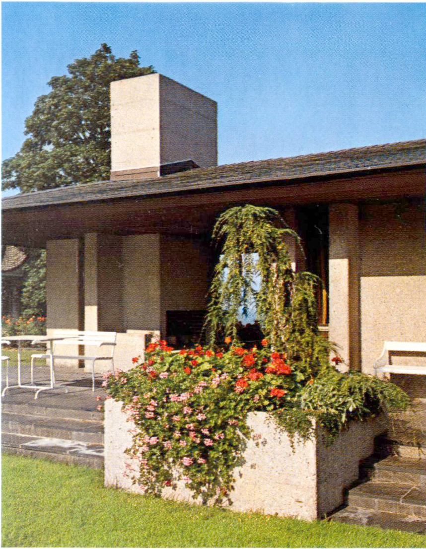
Terrasse couverte avec cheminée. Le béton contribue à créer une liaison harmonieuse entre les pièces intérieures, les terrasses et le jardin.

face a été enlevé mécaniquement afin que les granulats deviennent visibles. On a obtenu ainsi un ton chaud et, grâce aux granulats apparents, des surfaces d'aspect agréable.