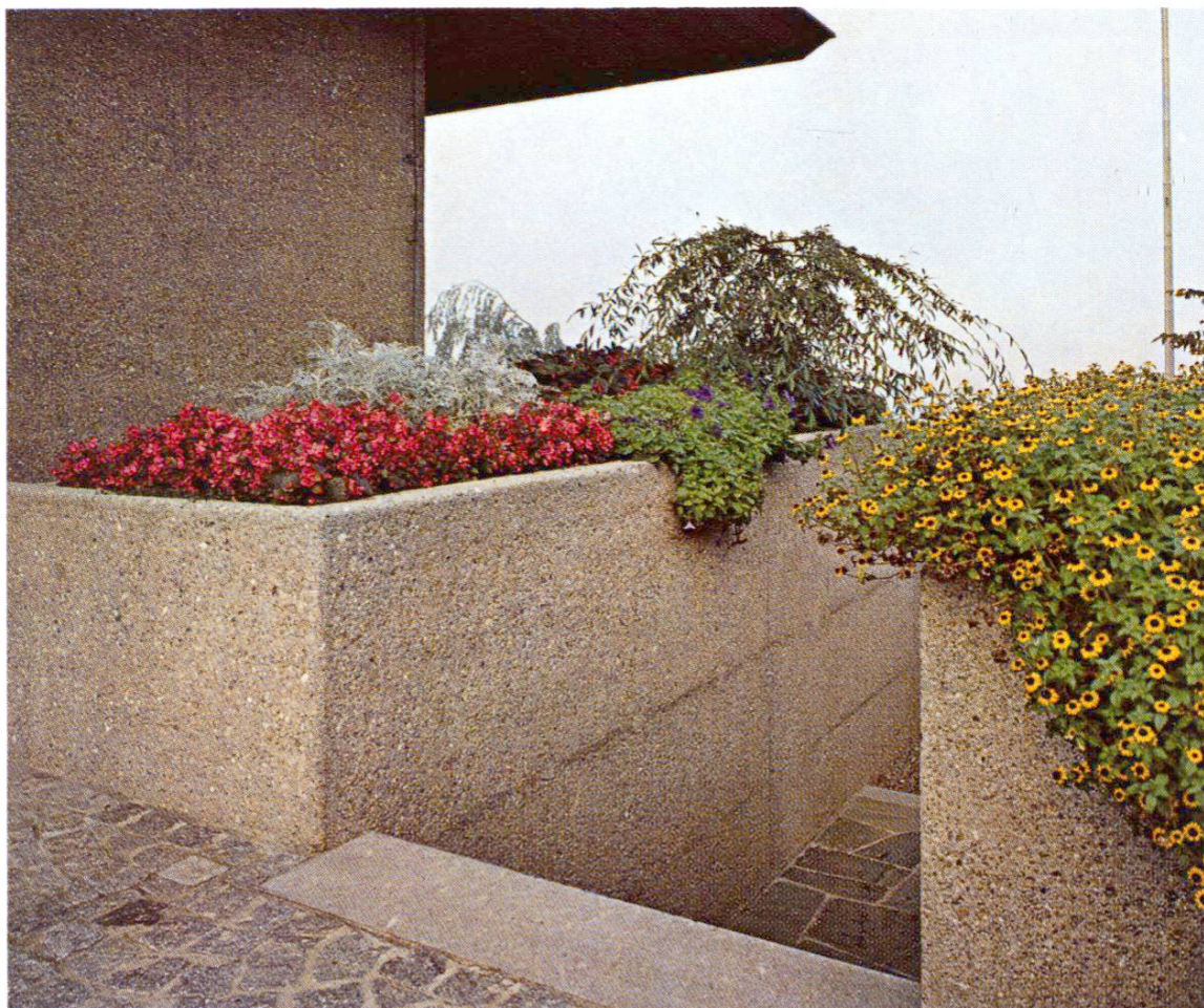
Passage entre des caissons à fleurs. Après bouchardage, de légers défauts d'étanchéité des joints de coffrage sont encore plus visibles que dans un béton apparent sorti brut de coffrage.

L'armature (fers principaux, étriers, attaches) doit avoir un recouvrement de béton d'au moins 4 cm à cause du bouchardage. Les taquets de distance doivent également être en béton teinté. Ce n'est qu'après la mise en place des bétons des parties supérieures que le bouchardage fut exécuté, ceci afin d'éviter que les surfaces traitées ne soient souillées par des coulures de ciment, de la rouille, etc. Le travail fut rendu plus difficile car certains bétons avaient déjà acquis une grande dureté. Il serait plus facile de boucharder un béton venant d'être décoffré, mais on risquerait alors de faire sauter les gros grains du granulat.