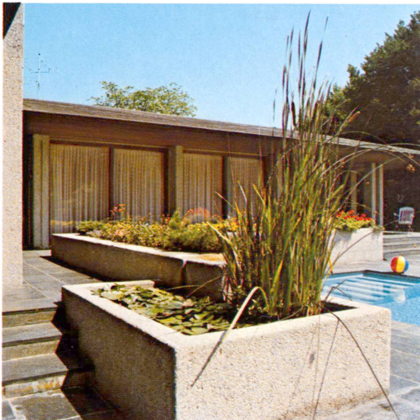
Bassin de nénuphars, caissons à fleurs et piscine.