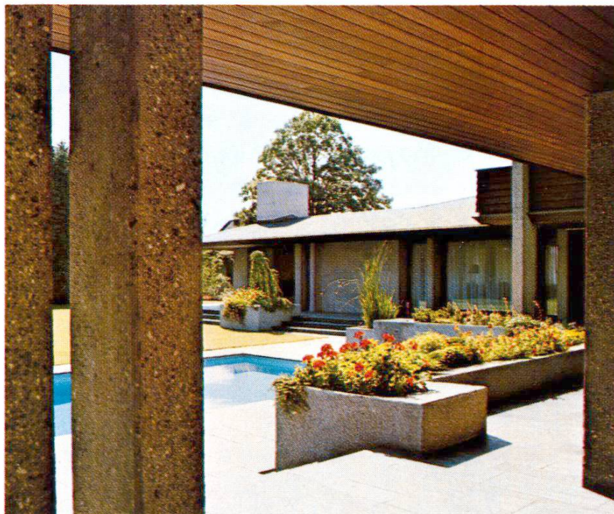
Gargouille d'un caisson à fleurs. Les grandes surfaces sont bouchardées mécaniquement, les arêtes et les petites surfaces à la main.