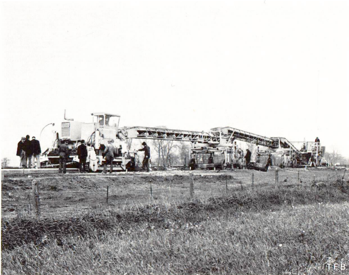
Fig. 1 Train de machines pour le bétonnage de fondation en béton pour voie de chemin de fer. En avant, à droite, l'alimenteur de béton avec son silo basculant. Ensuite deux chariots avec les treillis pour les armatures inférieures et supérieures et enfin la finisseuse à coffrage glissant et tout à gauche la machine qui prépare les trous de scellement des attaches. Des rubans transporteurs acheminent le béton frais en s'appuyant sur les chariots.

Nous remercions la revue «Concrete» de nous avoir autorisés à reproduire les photos et de nous les avoir prêtées.