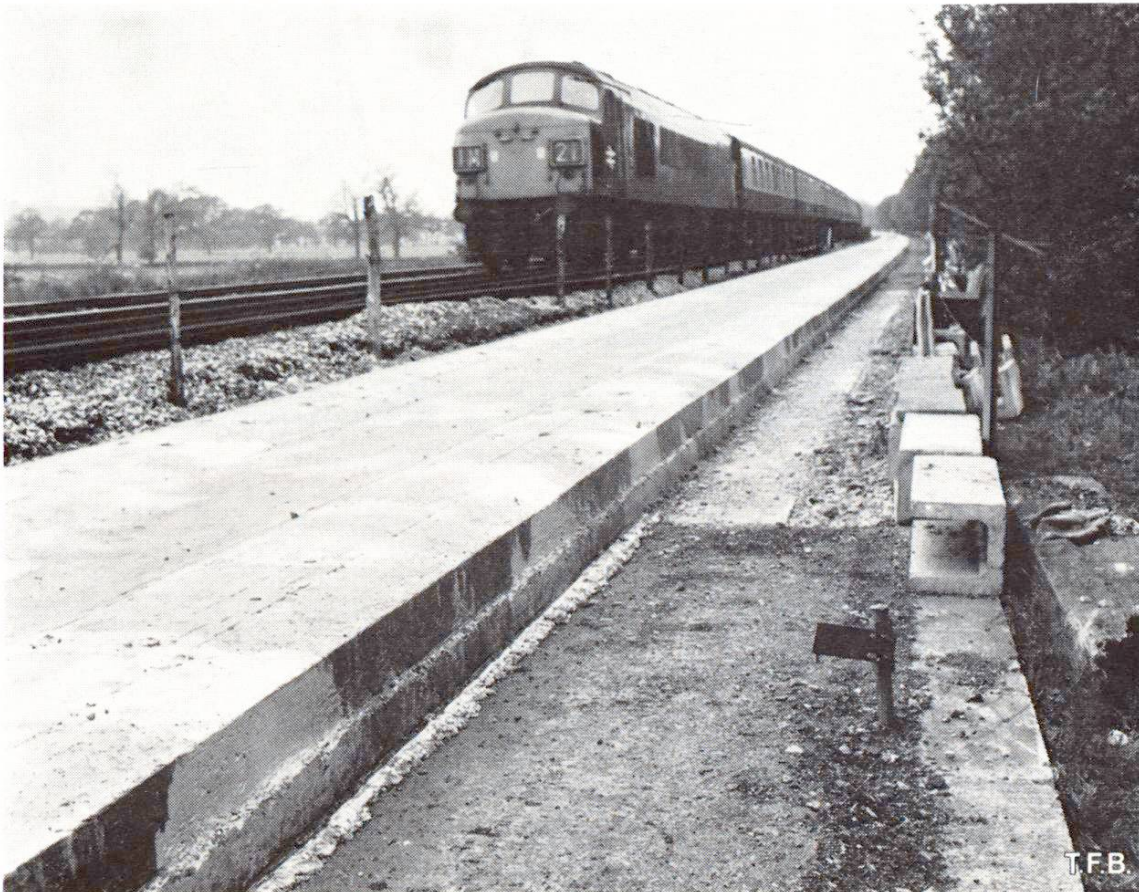
Fig. 4 Dalle de béton nue destinée à recevoir une voie. Il s'agit du tronçon d'essai pour des trains très lourds et très rapides.