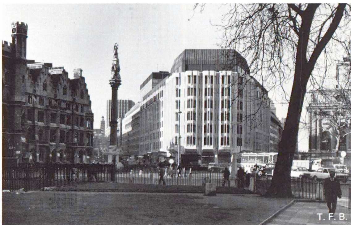
Fig. 1 Abbey House à l'angle Victoria Street–Tothill Street, en face de l'Abbaye de Westminster.

Abbey House se trouve en un endroit très célèbre de Londres, au bout de Victoria Street, en face de la magnifique Abbaye de Westminster. Sa conception a fait l'objet d'études approfondies, non seulement par les autorités techniques compétentes, mais aussi par l'éminente commission artistique royale qui a imposé des exigences très sévères concernant les dimensions et le caractère de la construction. Malgré