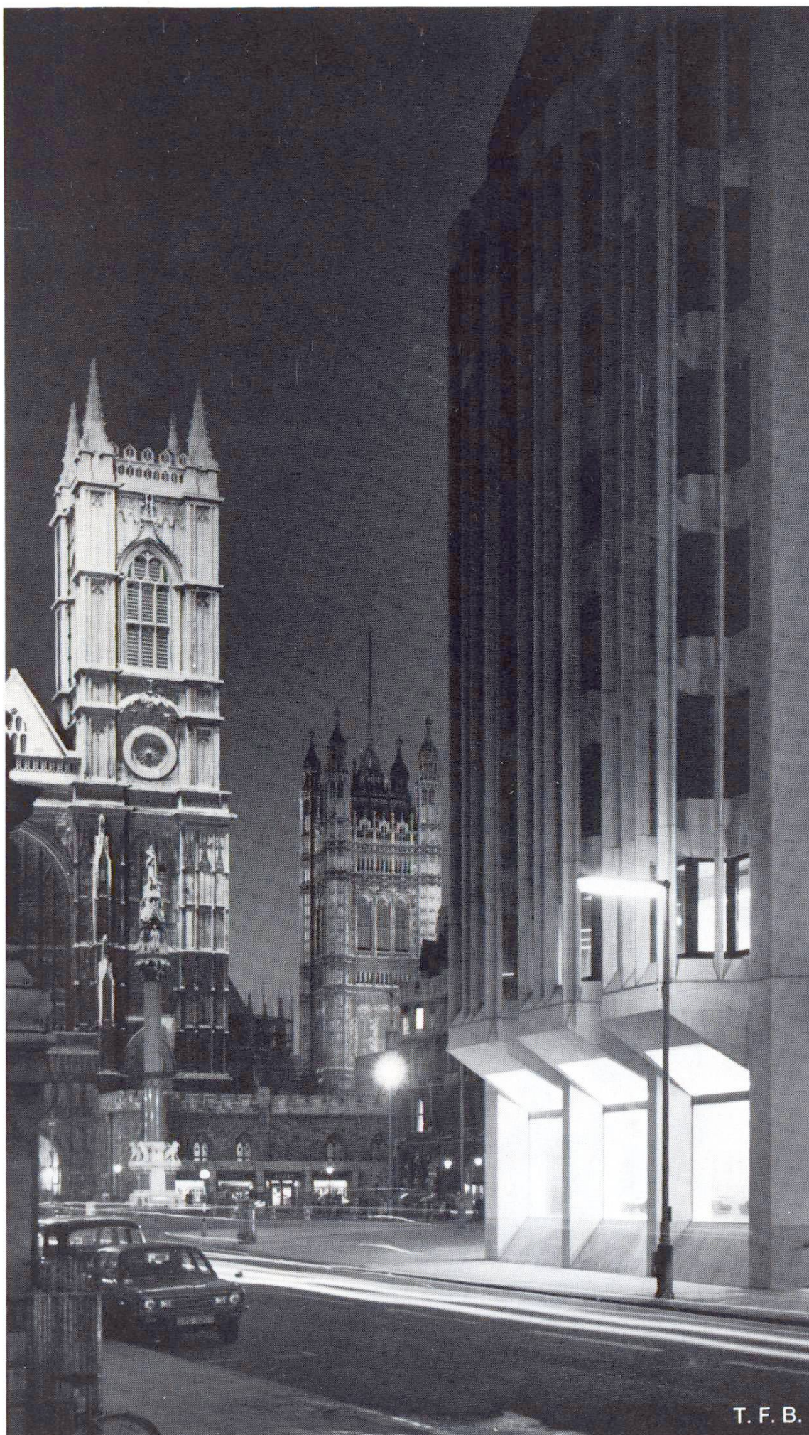
Fig. 6 Dans un environnement historique, un édifice moderne étudié soigneusement jusqu'en ses moindres détails.