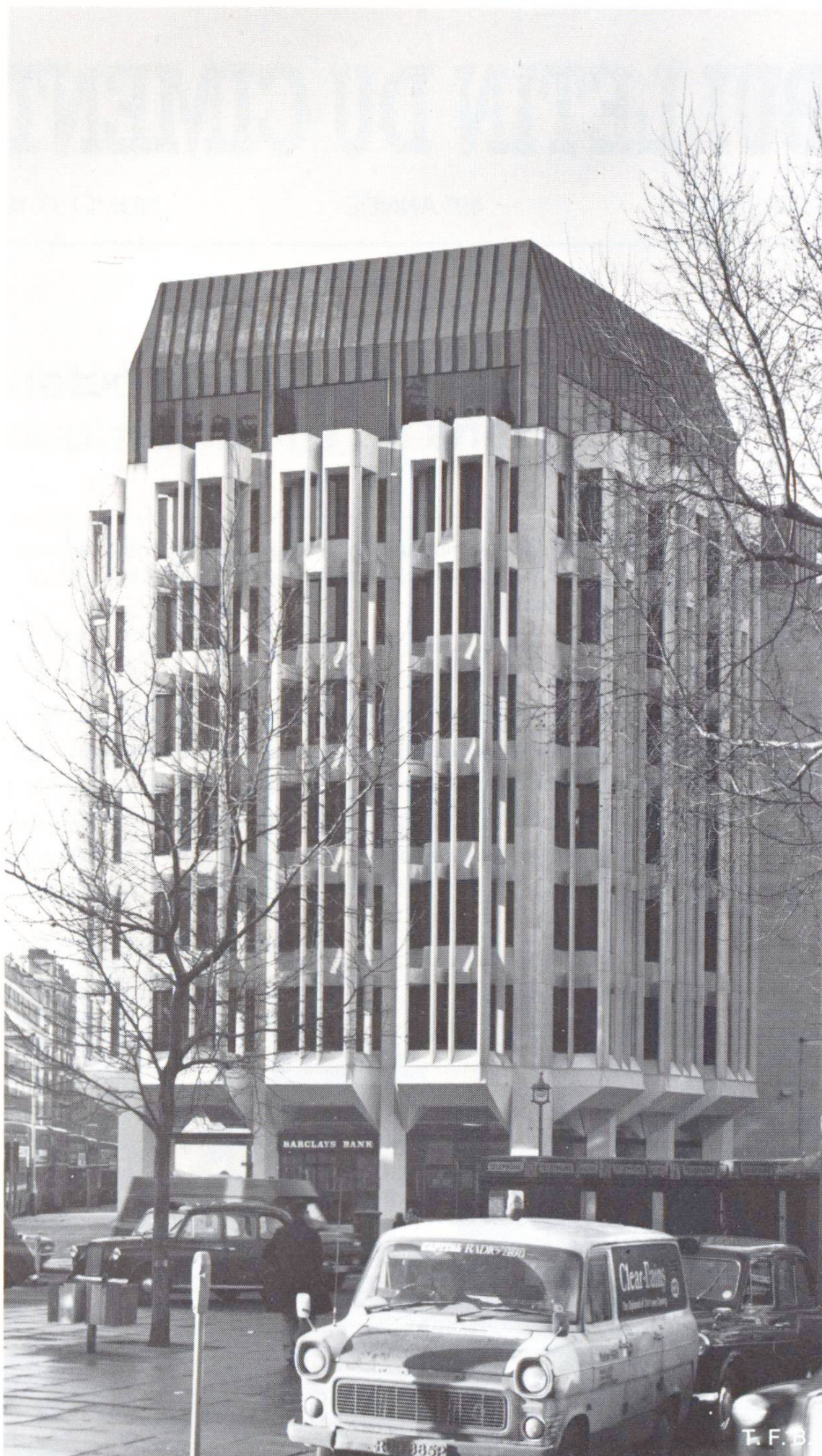
Fig. 2 Les fines colonnes verticales attachées en haut et en bas sont comme les cordes d'une harpe.