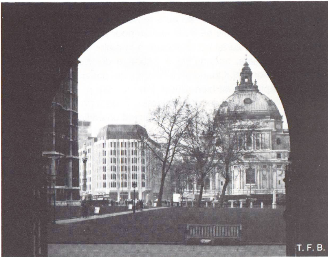
Fig. 3 Abbey House et Westminster Central Hall vus de l'entrée de la chapelle de St. Margret.