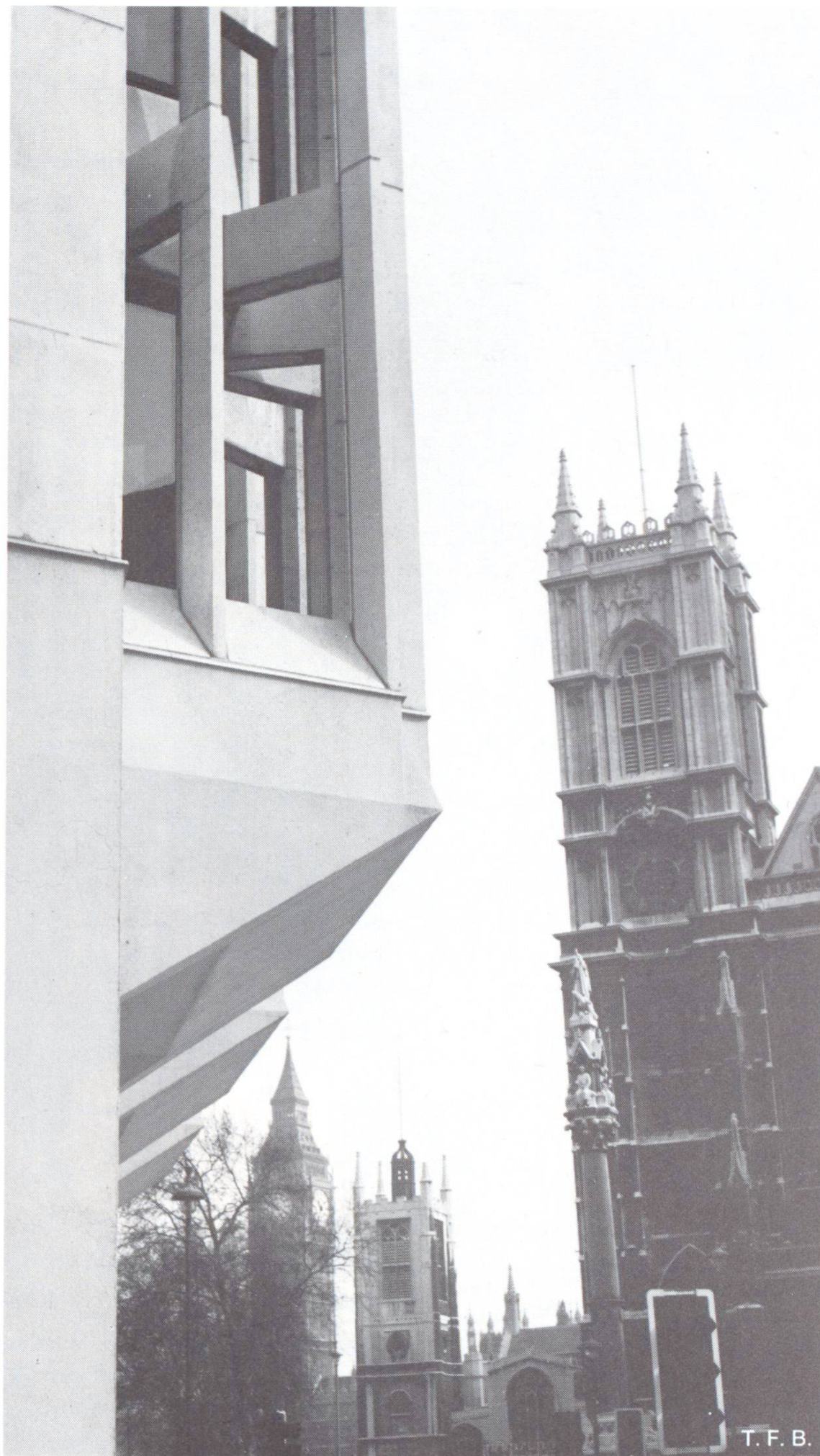
Fig. 5 Un angle d'Abbey House, en face de la chapelle de St. Margret, de l'Abbaye de Westminster et de Big Ben.