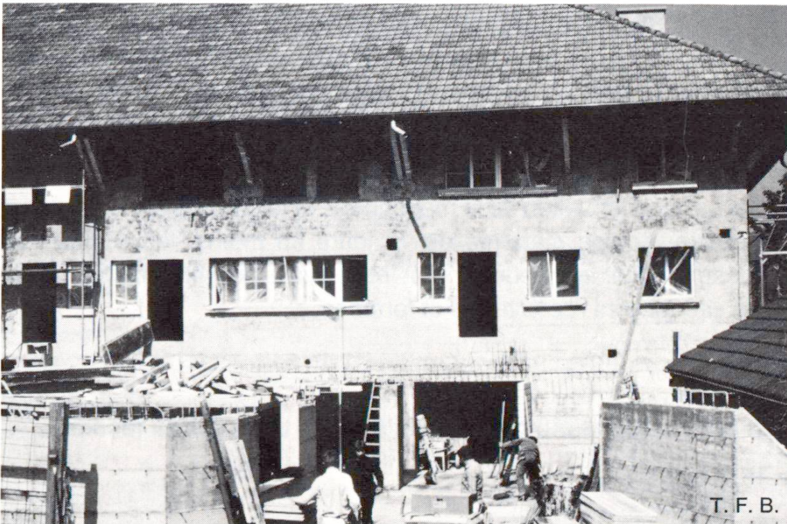
Fig. 1 Le support du crépi – ici une maçonnerie en briques cuites – est pourvu d'une première couche de ciment qui, après durcissement, recevra le crépi de fond à la chaux.

– Il est un élément de l'aspect de la façade, en général en liaison avec un enduit ou une peinture. Le crépi de fond, considéré comme