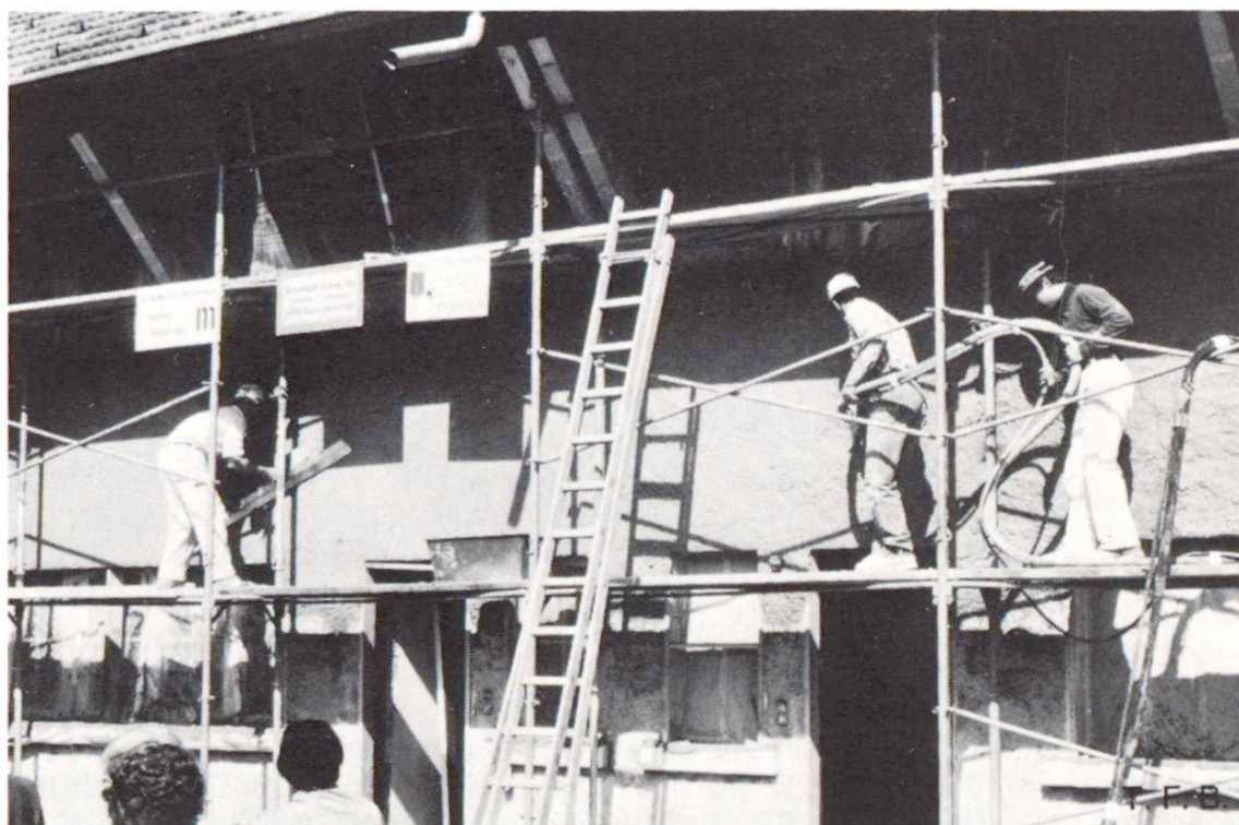
Fig. 3 Application du mortier au pistolet en une seule couche et égalisation à la latte.