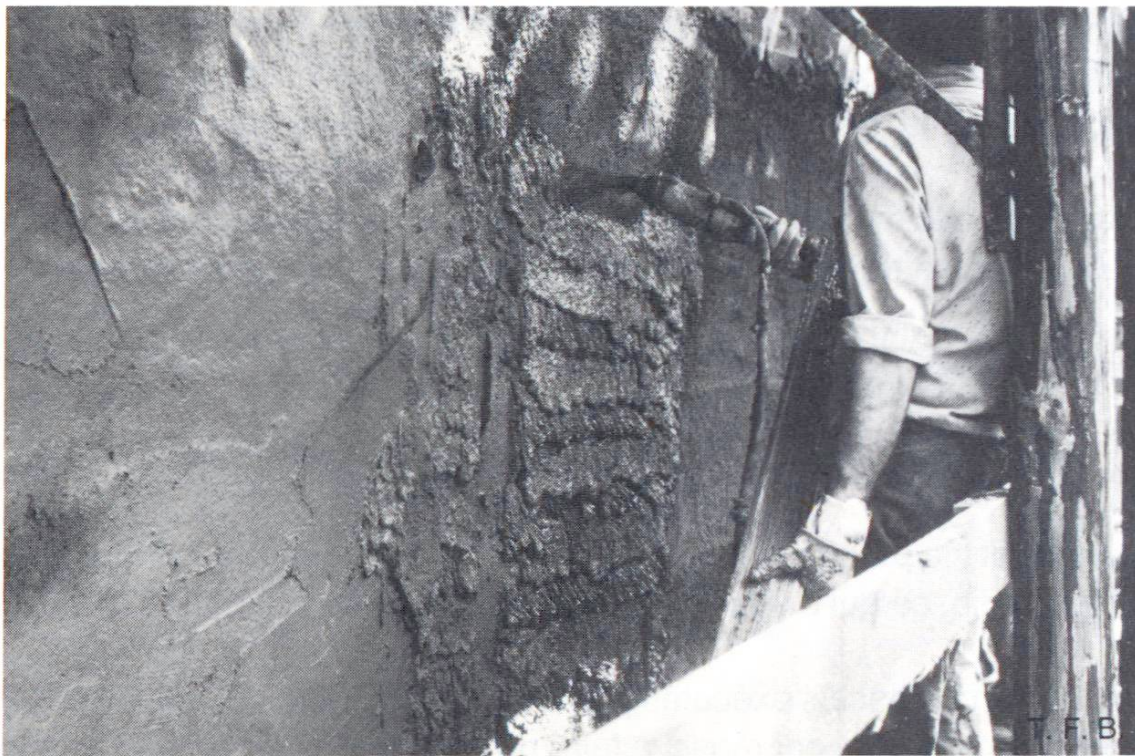
Fig. 4 Détail de l'application.