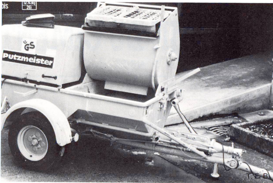
Fig. 2 Pompe à vis P 11 pour malaxage et transport du mortier.

support d'un enduit (avec motif) ou d'une peinture, doit former un tout avec eux, notamment en ce qui concerne la perméabilité à la vapeur . Les crépis et enduits traditionnels remplissent cette condition.