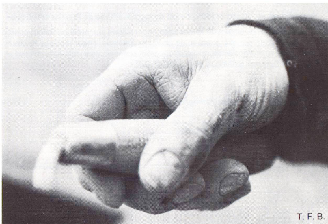
Fig. 2 Danger de lésion par la poignée des outils.

mesures de protection. Il faut donc veiller dès le début à ce que le ciment sec n'entre pas en contact avec des parties humides de la peau et à ce qu'en aucun cas l'eau du béton n'atteigne la peau, p. ex. par l'intermédiaire de vêtements mouillés par le béton. Ces brûlures sont douloureuses et longues à guérir, notamment parce qu'elles affectent des parties du corps exposées au frottement des vêtements. La guérison, c.-à-d. la reconstitution d'un épiderme suffisamment protecteur, demande souvent beaucoup de temps.