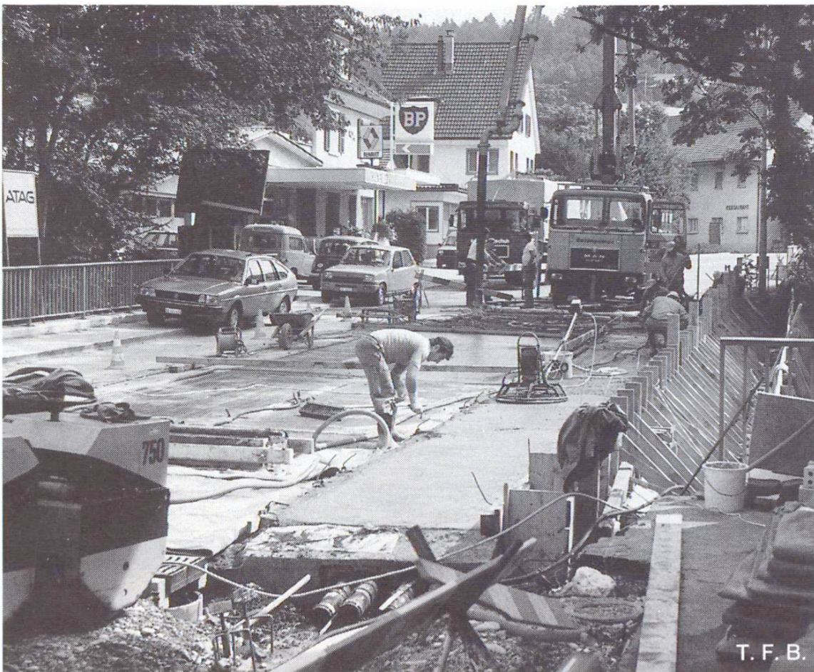
Fig. 5 Pont sur l'Erzbach (AG/SO). Route cantonale à trafic unidirectionnel. Bétonnage de la 2e étape avec traitement par le vide.

déjà trop tard (p.ex. si le foehn se lève pendant la nuit). Ce qui convient bien pour cette protection, c'est la couverture par une feuille de plastique ou par des nattes isolantes. L'application d'un produit de cure liquide n'est efficace que si elle est très uniforme, ce qui n'est pas toujours possible pour des raisons pratiques.