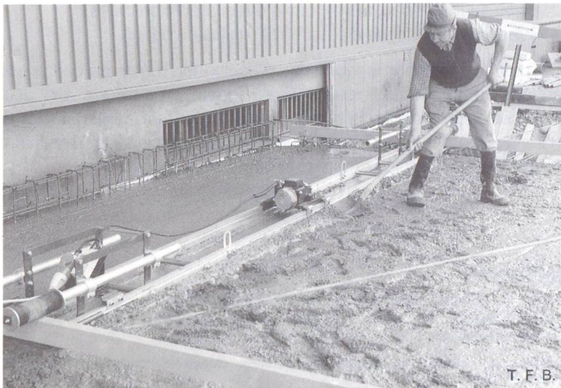
Fig. 1 Réglage de la surface au moyen d'une poutre vibrante.