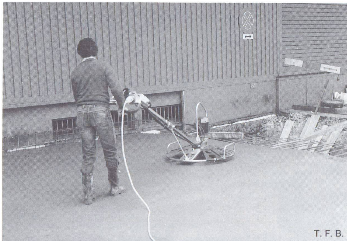
Fig. 3 Finissage de la surface. Talochage mécanique.