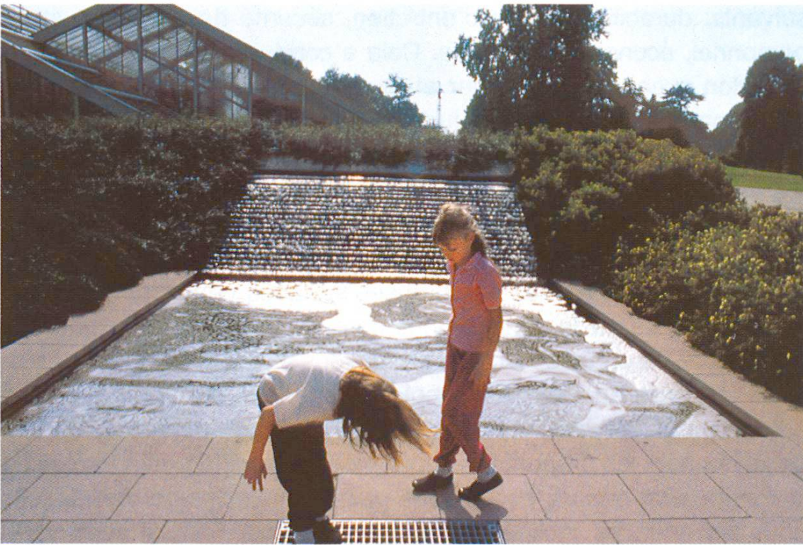
Cascade et bassin à côté de l'entrée principale.

Maître de l'ouvrage: Royal Botanic Gardens Projet: Property Services Agency, Croydon Exécution: Kier Southern Ltd.