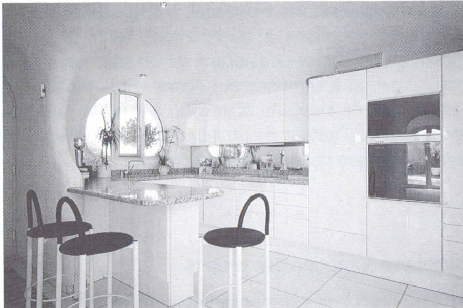
Construction, espace, équipement