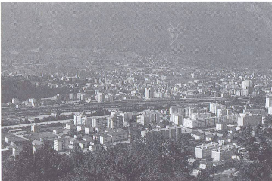
Intrusion de la construction dans le paysage