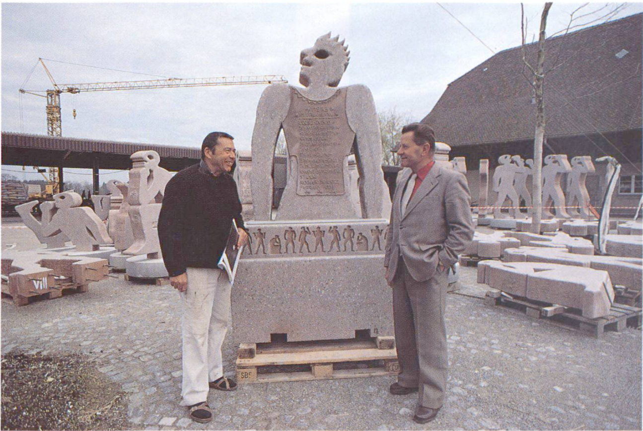
Les figures prêtes à être mises en place. Au milieu, «Exhortation à s'amender»