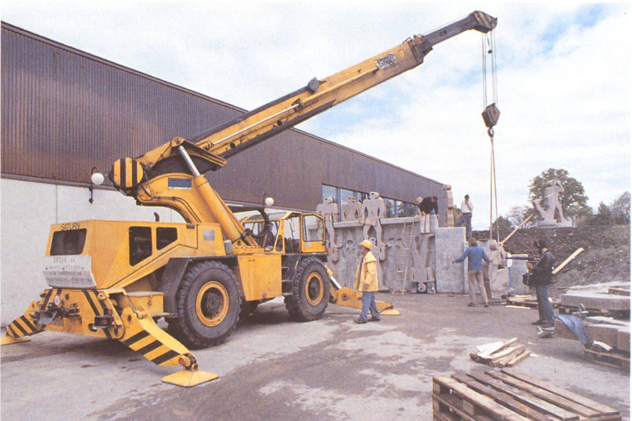
Travaux de mise en place