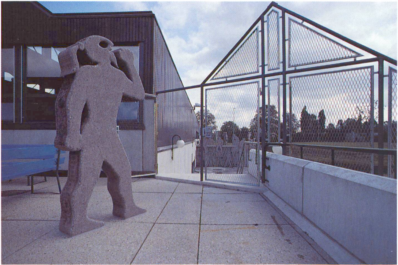
De la place de récréation au terrain de sport