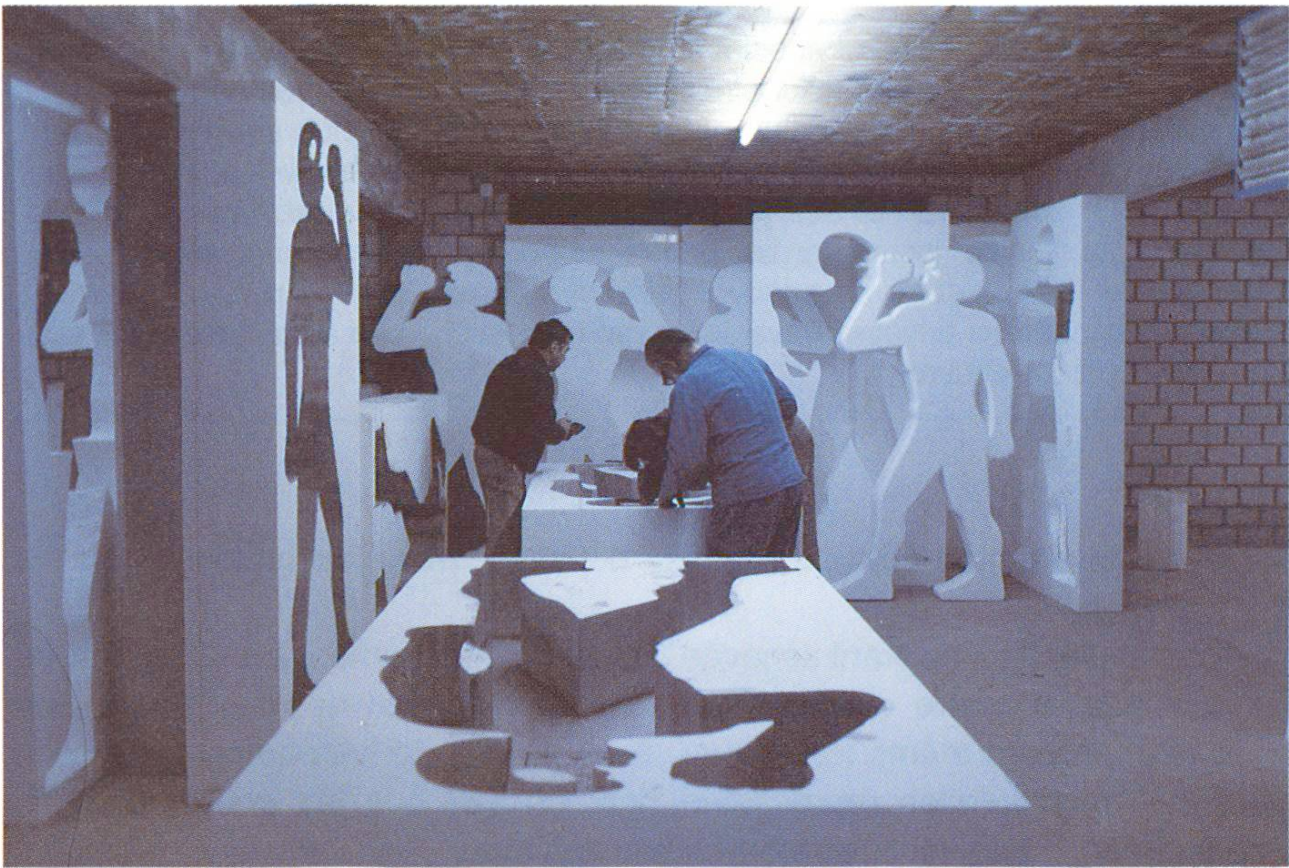
Coffrage en mousse synthétique. Travail sur le négatif

douzaine d'artistes. Parmi elles, la quarantaine de sculptures de Peter Trava- glini constitue certainement l'œuvre la plus spectaculaire. Elles ont été exécutées pendant les travaux principaux de 1982/83. Thème: La privation de liberté.