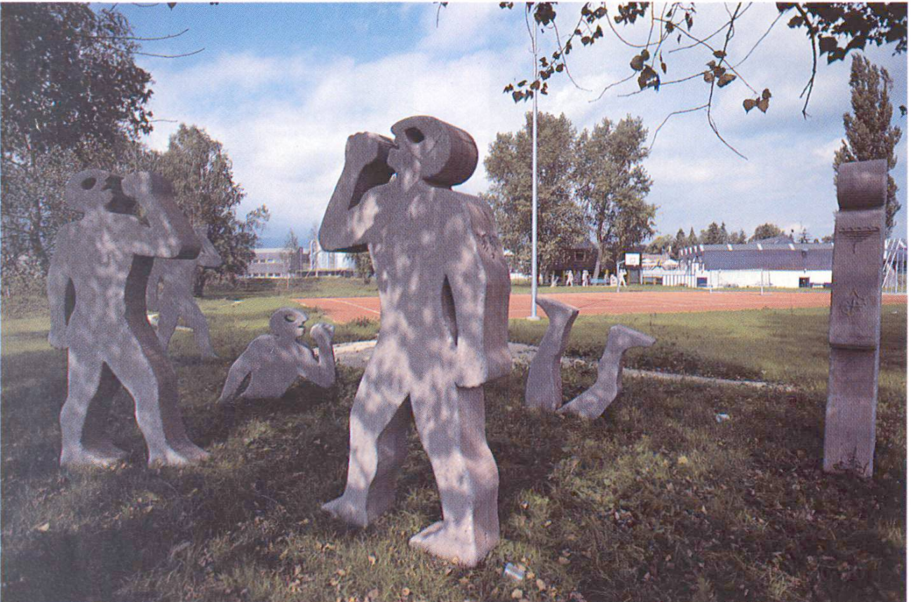
A côté du terrain de sport