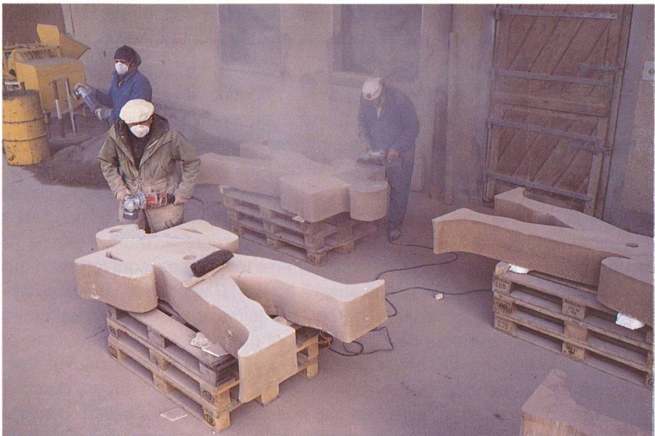
Préparation des sculptures démoulées. Meulage des arêtes et des surfaces