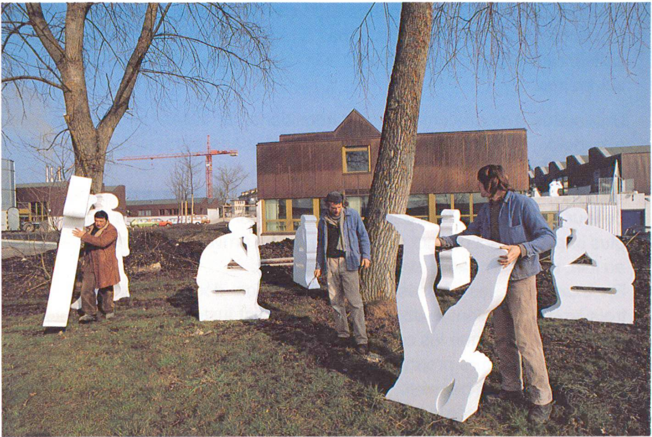
Groupement et mise en place des figures à l'aide des positifs