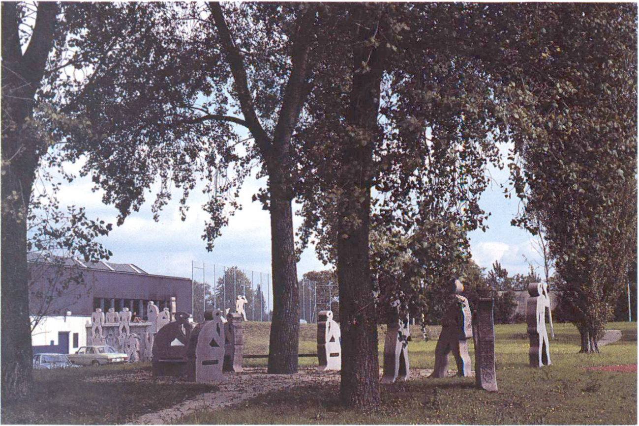
Conversation sous les arbres