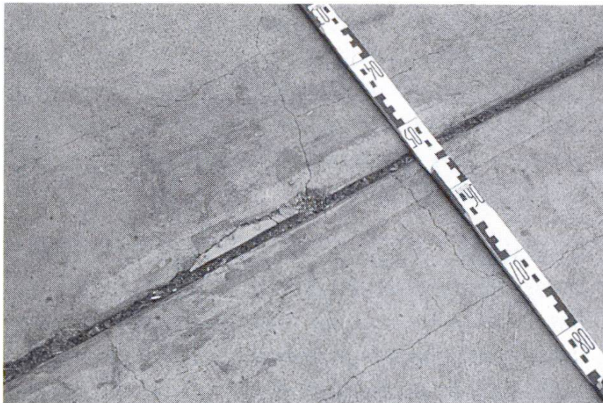
Fig.4 Ecaillage le long d'un joint et fissuration verticalement au joint. Raison: contraintes de cisaillement plus élevées dans la zone des joints et passage de véhicules; faible adhérence et trop forte sollicitation.

suffisamment longtemps. Cette couche d'accrochage est le plus souvent une barbotine composée de mortier de chape gras et très plastique, que l'on tire en couche mince, par exemple par brosse mécanique et avec un balai. Cette couche ne doit en aucun cas sécher, sinon elle agit en tant que couche de séparation, tout comme le ferait une barbotine purement de ciment. Lors de la mise en œuvre du mortier, il faut tenir compte des conditions atmosphériques (température, humidité de l'air, vent). Il n'est pas possible de réussir l'application d'une chape en ciment à des températures inférieures à +5°C. L'outillage nécessaire est mentionné dans le tableau 1. Il ne faut pas travailler la surface trop longtemps avec la machine à