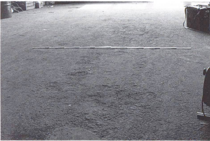
Fig.2 Chape en ciment d'un local artisanal dont la surface est fortement endommagée. Raison: groupe de sollicitations II et composition du matériau incorrecte.