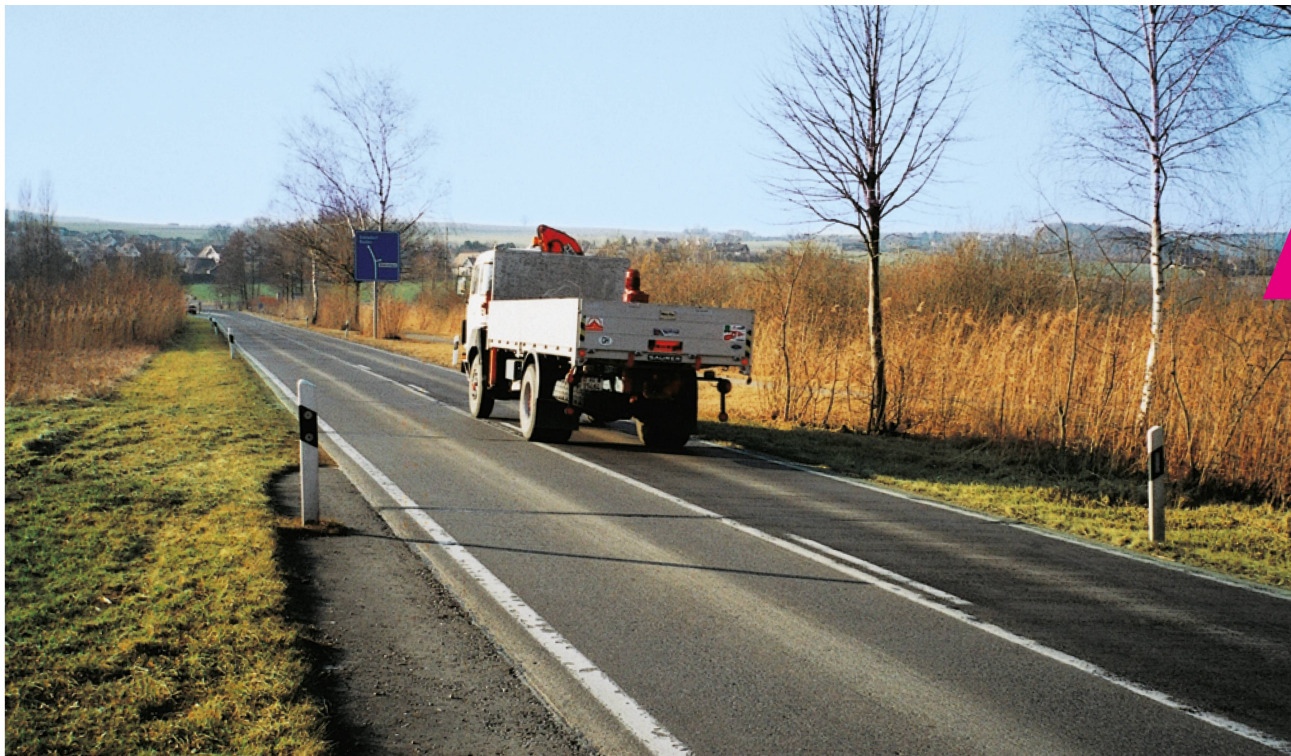
Route cantonale Oberhöri-Dielsdorf (Neeracher Riedt). Cette route construite en 1951 traverse la zone marécageuse. Elle se relève et s'abaisse de 1 à 4 cm par année, en fonction de la nappe souterraine; niveau de la nappe souterraine: bord inférieur du revêtement en béton!