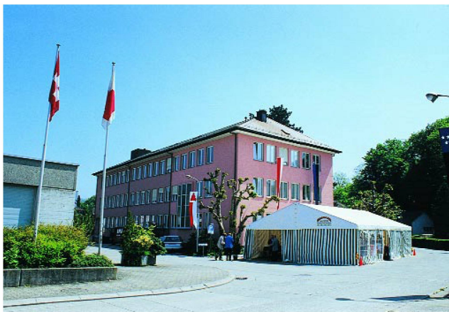
Le calme avant la tempête.

Approximativement 600 à 800 personnes ont visité le TFB à Wildegg les 7 et 8 mai 1999. Herbert Odermatt était présent avec sa caméra.