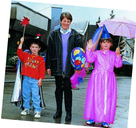
L'heureuse gagnante du premier prix.