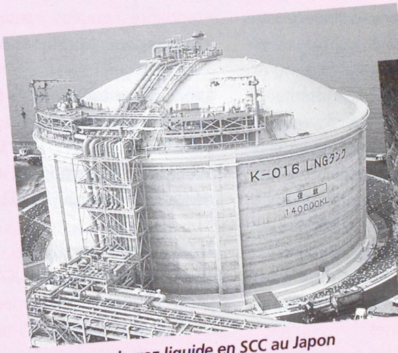
Conteneur de gaz liquide en SCC au Japon