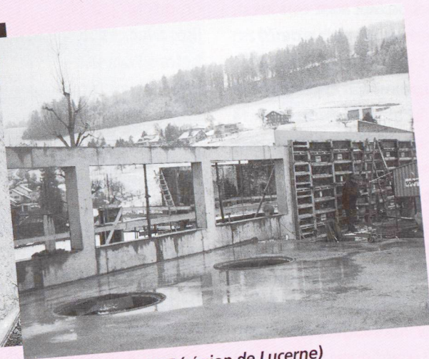
Béton apparent SCC (région de Lucerne)