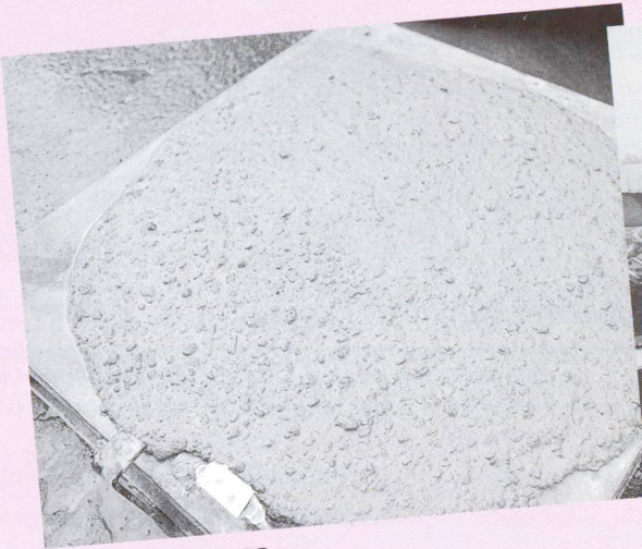
Consistance du SCC