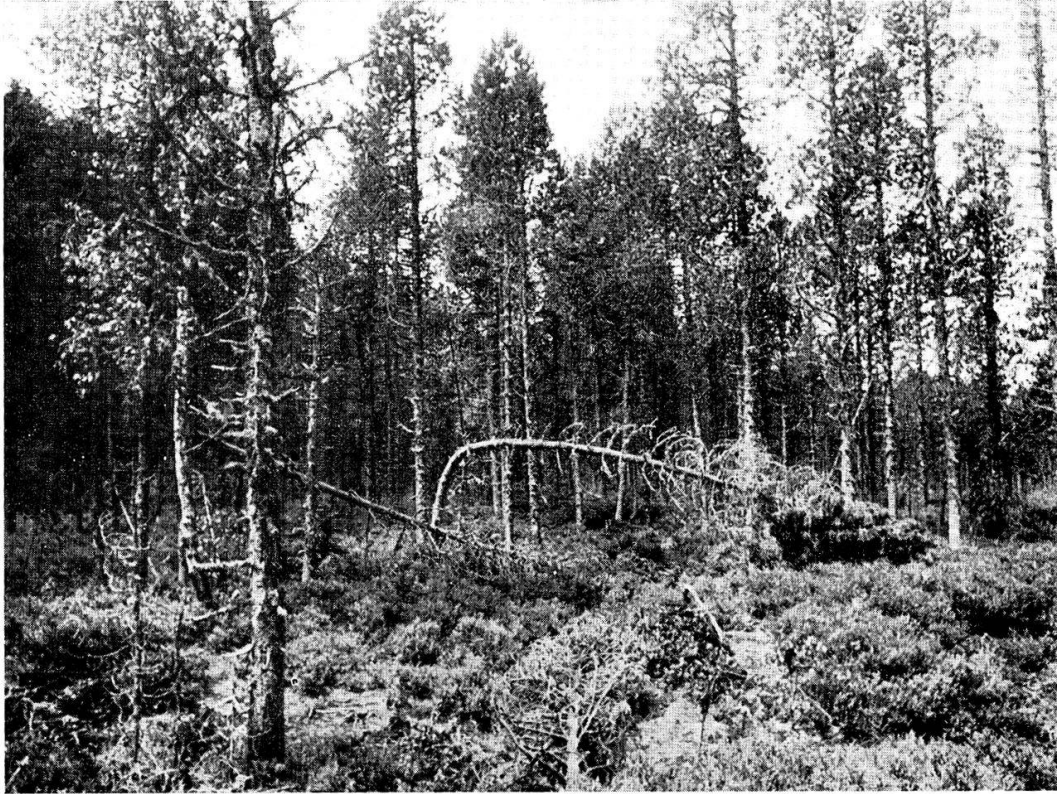
1. Pineto-vaccinietum (grande pinède).