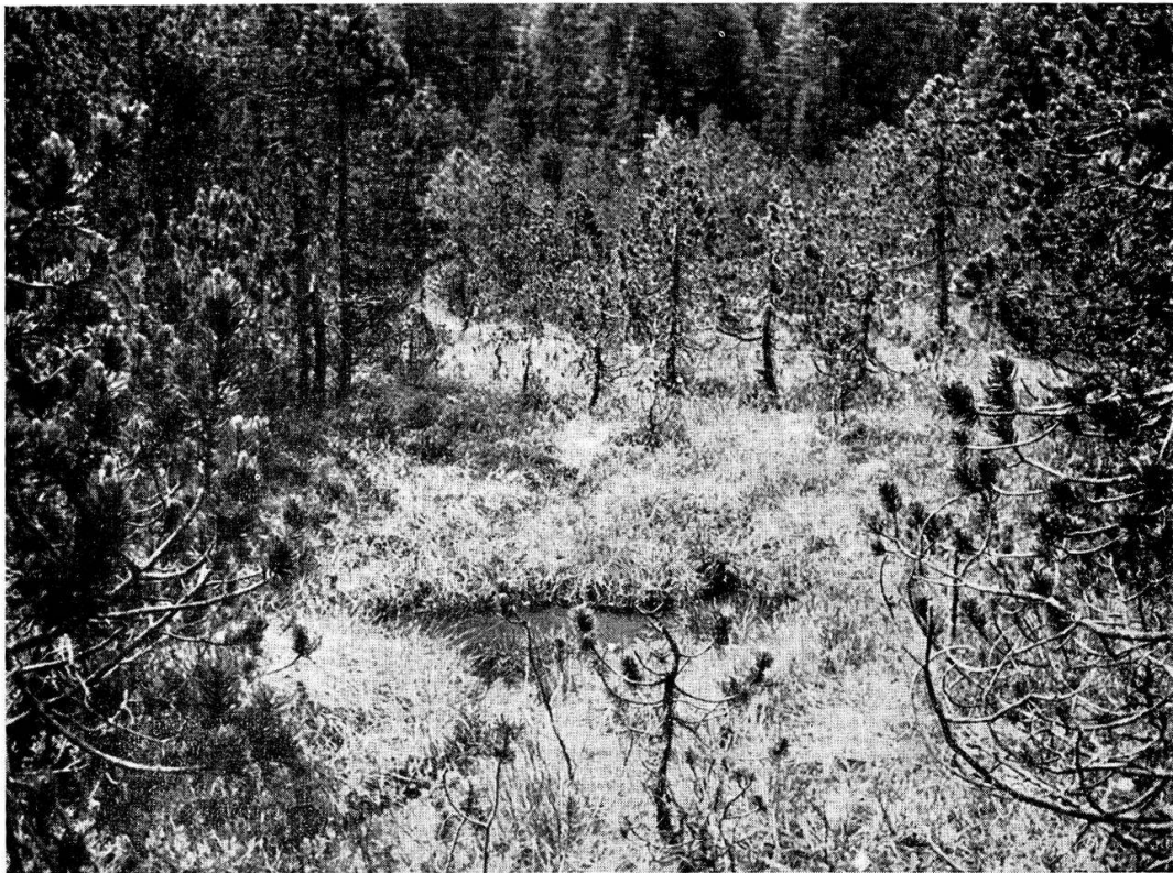
2. Sphagneto-eriphoretum (petite pinède).