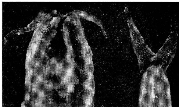
Abb. 3. links: Frucht mit Narben von Inversodicraea ; rechts: Frucht mit Narben von Dicraeanthus ; Vergrößerung 15fach.

Thallus tief geteilt; Abschnitte 2–5 mm breit, am Rande mit blütentragenden Sprossen. Sprosse einfach oder verzweigt, 0,5–6 cm hoch. Blätter bandförmig, bis 10 mm lang und 0,2–0,4 mm breit, oft an der Basis beiderseits mit einem Zahn. Spathella ellipsoidisch; die von ENGLER angegebene Einschnürung in der Mitte der Spathella ist nur ausnahmsweise deutlich zu sehen. Blüten in der Spathella nach unten gewendet. Blütenstiel zur Fruchtzeit 1–3 cm lang. Tepalen 2, fadenförmig. Antheren 2, gelegentlich 3, 1 mm lang und 0,7 mm breit, 2fächerig. Pollenkörner einzeln, von besonderer Form: Im Längsschnitt elliptisch 34–38 \mu lang, 23–26 \mu breit; im Querschnitt auf