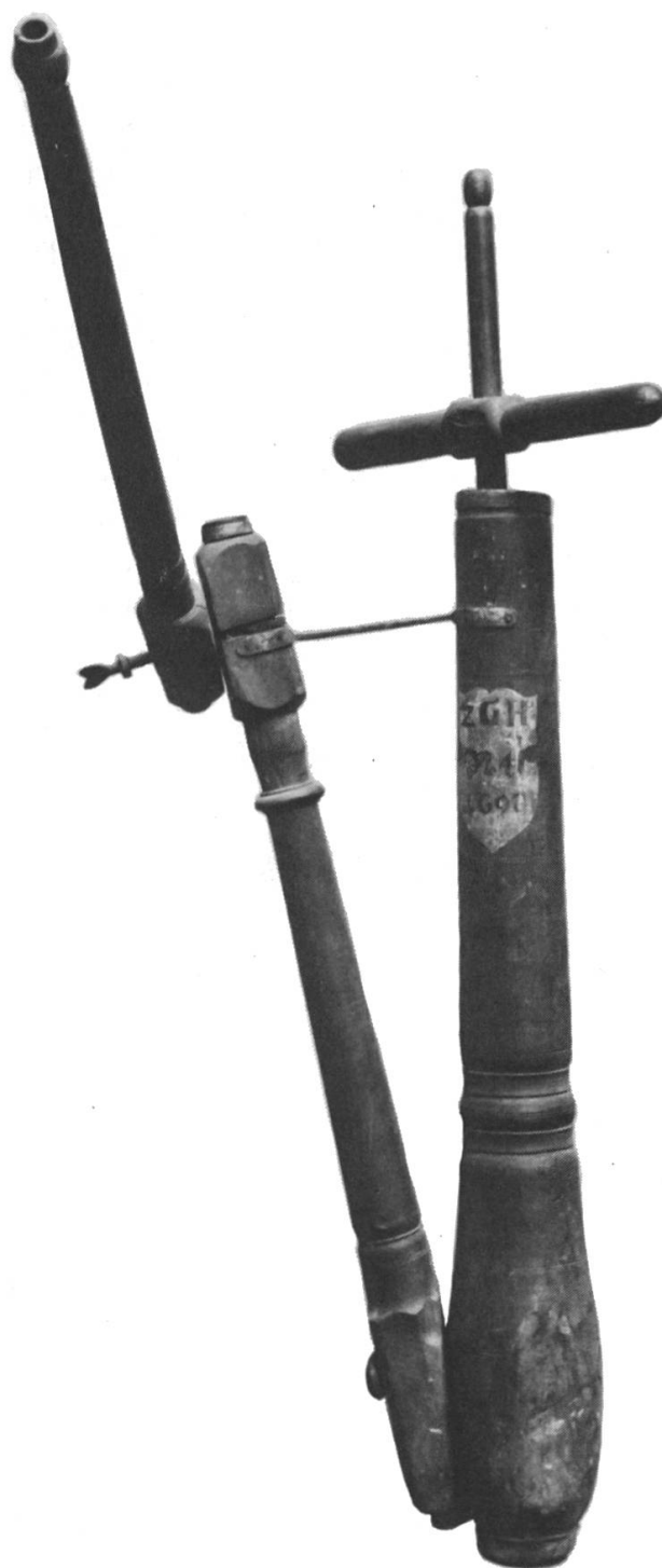
9. Alle drei Spritzenrohre dieses Sprizentyps aus dem Jahre 1692 sind durch Gelenkdurchflüsse miteinander verbunden. Durch stetes Betätigen des Kolbens wurde ein stossweiser Wasserstrahl verursacht. Das Bodenstück stand für den Gebrauch der Spritze in einem wassergefüllten Zuber, der mit Hilfe der Eimerkette Wassernachschub erhielt. Schweiz. Feuerwehrmuseum Basel.