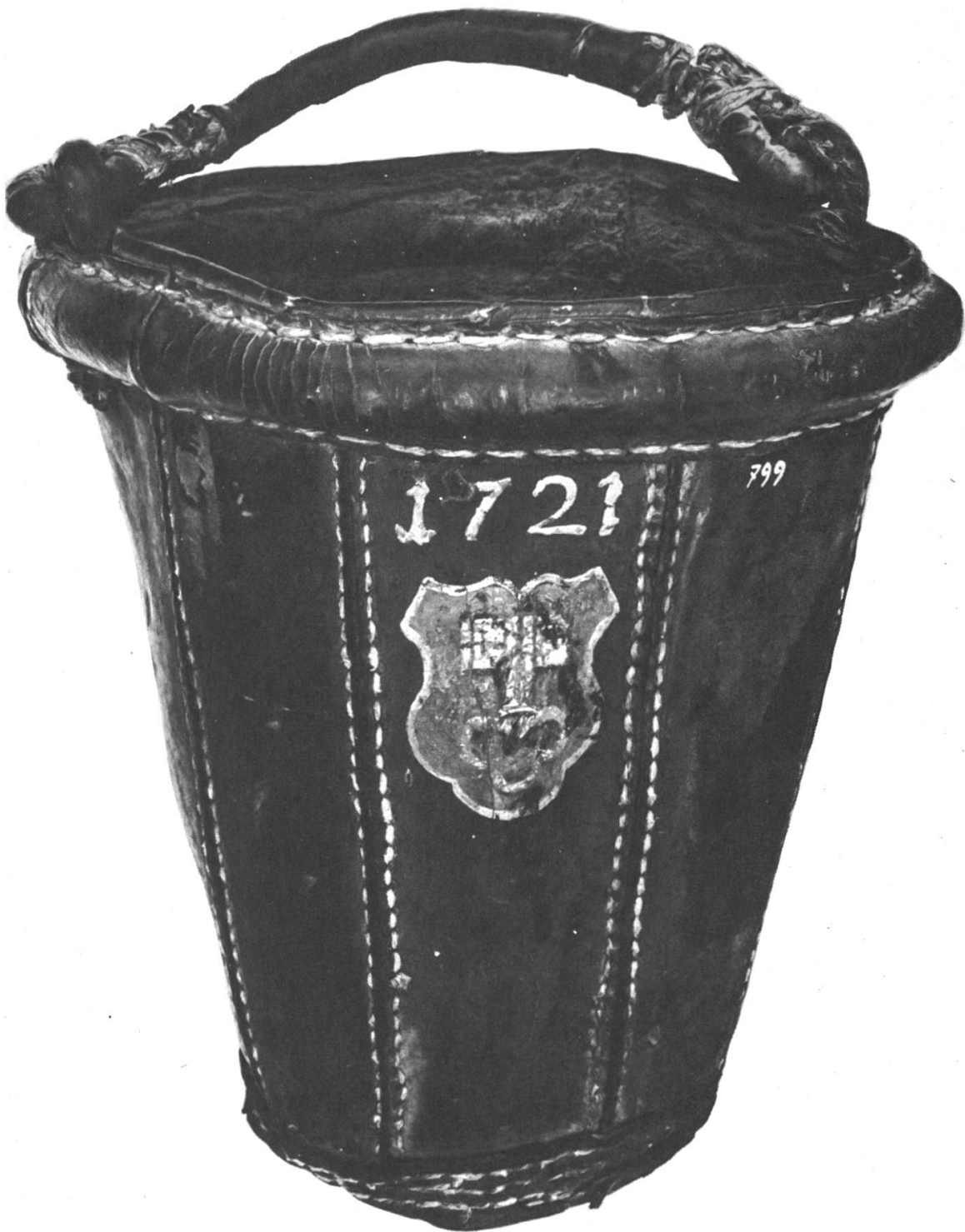
6. Der handliche, lederne Wassereimer, der sog. «Feuerkübel», war noch im 18. Jahrhundert wichtigstes Hilfsmittel für die Brandbekämpfung. Im Ernstfall wurden die Kübel von Hand zu Hand gereicht. Das abgebildete Exemplar befindet sich im Historischen Museum Stans.