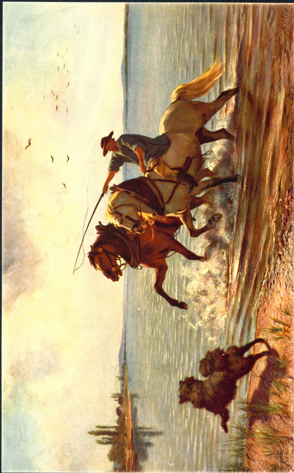
Nach einem Gemälde von Rudolf Koller