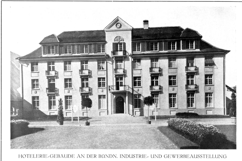
HOTELERIE-GEBÄUDE AN DER BÜNDN. INDUSTRIE- UND GEWERBEAUSSTELLUNG