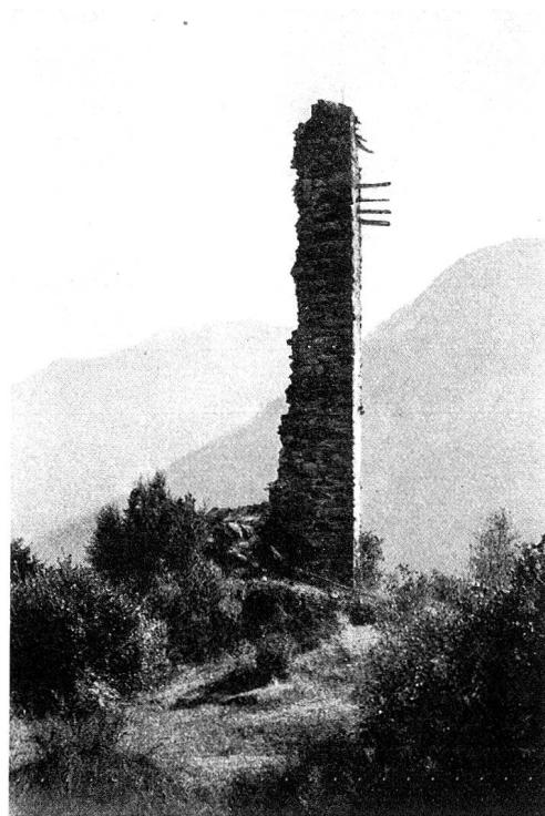
Wachtturm Cagliatscha bei Clugin-Andeer

Die Lukmanier- beziehungsweise Bündner Oberländer Feuerzeichen-Verbindung zeigt von einer Hauptwarte zur andern so große Abstände, daß an akustische Alarmsignale kaum gedacht werden darf. Vom Ausgangspunkt Reichenau schiebt Poeschel im «Burgenbuch» Seite 183: «Der Platz ist wichtig wegen der Lukmanierstraße von Felsberg her und der Umgehungsroute Pfäfers-Kunkels-Tamins. Urkundlich zuerst 1257.» Und von Hohentrins (Canaschal) schreibt er: «Der Turm wohl in der ersten Hälfte des 13. Jahrhunderts von den Herren von Frauenberg erbaut, die als Vögte des Klosters Reichenau hier saßen.» Der vier-