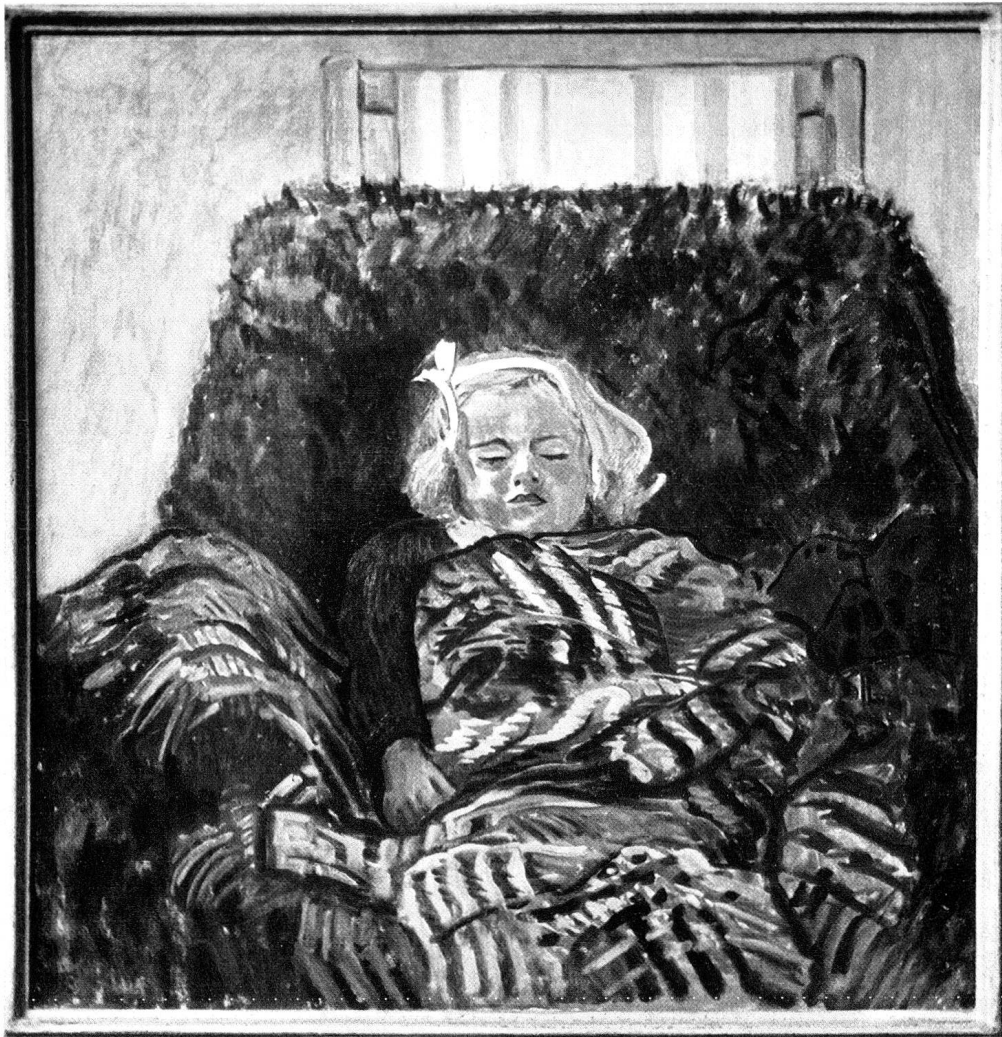
TURO PEDRETTI: SCHLAFENDES KIND AUF PELZ