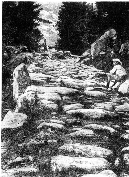
Castelmur-Straße 1387. Plattenbelag. Casaccia.