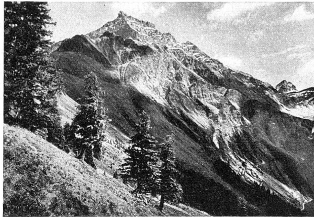
Beverin · Alpweide

Grashänge, die tiefeingefressenen Wildbachrunsen, an Felsköpfen und Steinwänden vorbei nach der Gratlücke beim Zwölfehorn abspielte. Selbstverständlich war dieser Verkehr nur im Sommer möglich, wenn der Schnee geschmolzen war und die Runsen nicht mehr mit Eis oder Wildwasser und rollenden Steinen gefüllt waren.