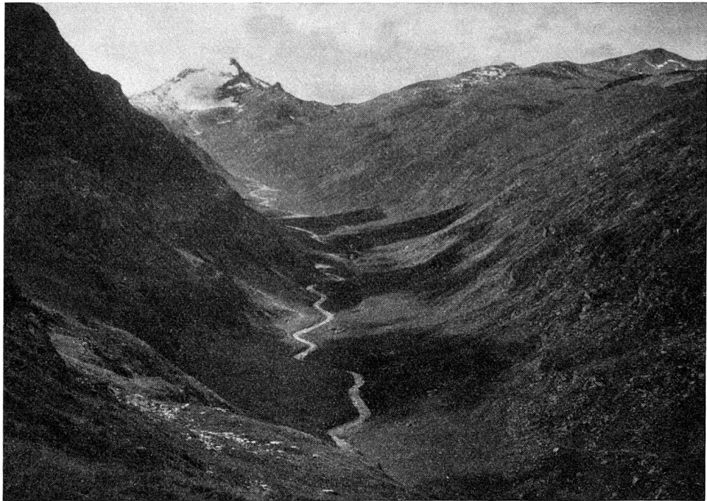
Blick vom der Furgge auf das langgezogene Val di Lei und Pizzo Stella, rechts davon Passo di Angeloga (Aufnahme aus der Zeit vor dem Kraftwerkbau)

Die Landschaft Schams machte geltend, daß die Gemeinde Plurs eine Alp habe, so die Alp Ley genannt werde und «auff der Schamsser zerung und gebit liege». Von dieser Alp gehöre auch den Schamsern ein Teil, den Podestat Meng den Plursern ausgeschätzt und ihnen verkauft habe. Auf dieser Alp habe Schams schon früher einen Schnitz getan, die Schätzer dahin geschickt und die Erzgruben verlost, ohne daß die Plurser dagegen Einsprache erhoben hätten. Nachdem die Landschaft neuerdings gezwungen sei, eine schwere Steuer zu erheben, habe sie auch die Ley-Alpen darin einbezogen. Da sich aber die Plurser weigerten, den Schnitz zu bezahlen, möge das Gericht einen Augenschein nehmen und zu Recht erkennen, «daß gedachte Alp Ley auff Ihr, der Schambser territorio lige».