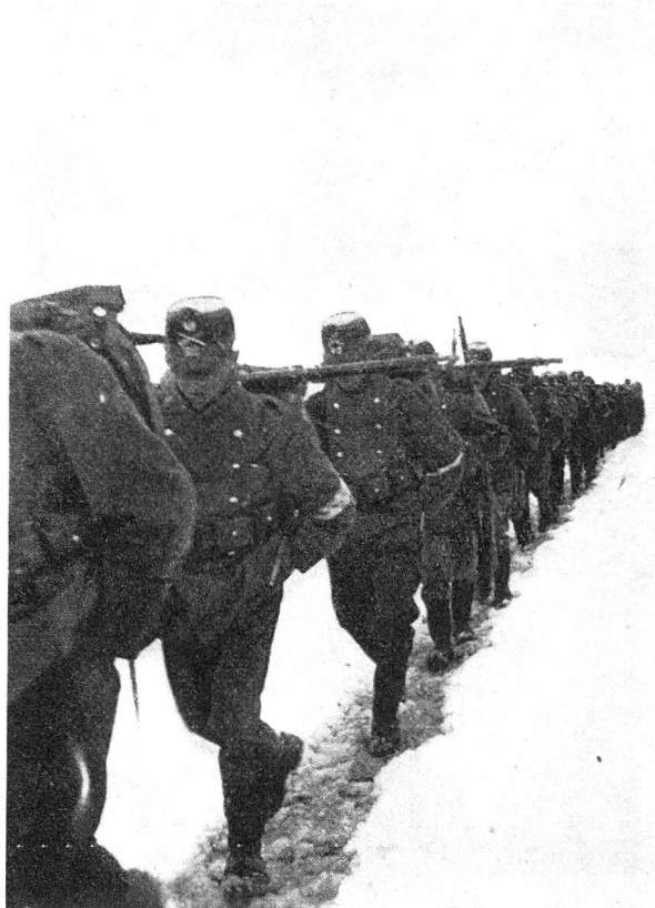
Im Hochsommer über den Albulapaß; Marsch nach Filisur. 1917

Einen Kameraden haben wir bereits verloren. Es war ein Rekrut, ein kleiner, dicker Kerl mit einem frischen, etwas unsympathischen Gesicht, einer von denen, die in den ersten Tagen ihr Soldatengewand mit unbe-