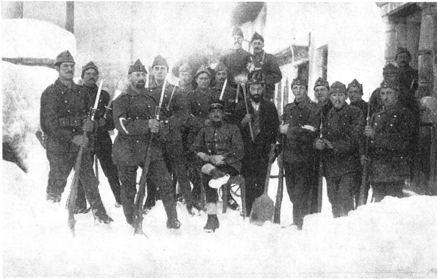
Sta. Maria im Münstertal 1916-17

Eine armselige Gestalt. Auf die Frage, was er wünsche, gab er mit zitternder Stimme die Antwort: «Eine Zigarette.»