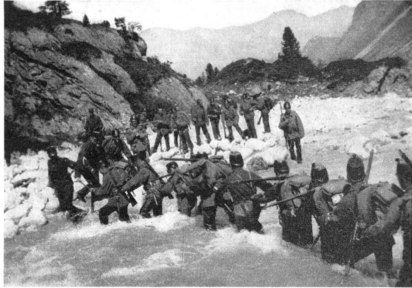
Geb. Inf. Kp. III/91 traversiert die wilde Orlegnia bei Maloja

in Splügen geschliffenes Bajonett mit dem Gewehr aus der Rekrutenschule. Nach 71 Tagen Aktivdienst in Splügen und Umgebung wurden wir entlassen. Aber noch im gleichen Jahr kam das Bat. 91 für 63 Tage nach Maloja. Auch in Maloja begann ein harter Dienst bei eisiger Kälte. Mit Turnen und Marschieren wurden wir aber erwärmt. Hier mußten wir sehr viel Wache stehen. Auch wurden tagelang Schützengräben ausgehoben.