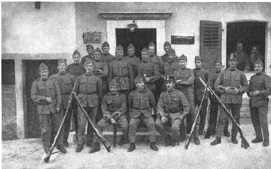
Wachtlokal in Metzerlen 1918

Dann kam das Jahr 1918. Das Bündner Regiment 36 mußte wieder einrücken. Anfangs März wurden wir nach Basel transportiert. Dort wurde das Regiment der Grenze entlang verteilt. Ich kam nach Metzerlen. Unsere Hauptaufgabe bestand in der Bewachung der Grenze. Daneben übten wir Taktschritt und Gewehrgriffe ohne Ende. Es war zur Zeit der Offensive an der Marne. Unser Abschnitt befand sich am Blauen, Richtung Hartmanns-