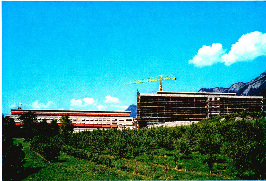
DAS KANTONSSPITAL CHUR ENDE JUNI 1965 MIT NEUBAU. Links der Altbau; rechts das neue Bettenhaus, im Rohbau fertiggestellt; dazwischen, eben noch erkennbar, der Verbindungstrakt mit zukünftigem Zentrallaboratorium und Pathologischem Institut.