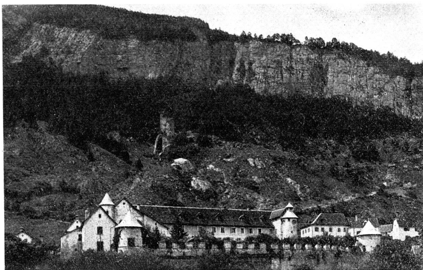
Schloß Haldenstein, Ansicht von Osten, 1923