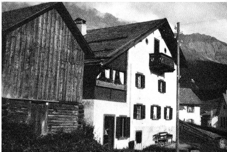
Geburtshaus von Leonhard Ragaz in Tamins

Gott Himmel und Erde» – bis zum letzten: «Komm, Herr Jesu!», und bei dieser ersten wirklichen Begegnung ist die Bibel ihm lebendig geworden. Er hat auch schon als Pfarrer zu St. Martin in Chur und in seiner ersten Basler Zeit als Pfarrer am dortigen Münster immer wieder Predigten gehalten, die durch ihren Gehalt an echt biblischer Wahrheit viele Menschen aufhören ließen. Aber erst während seiner Basler Jahre wurde ihm jene entscheidende Erkenntnis geschenkt. Was diese für ihn bedeutete, hat er selbst in seiner Autobiographie – unter der vielsagenden Überschrift «Das große Erlebnis» – ausgesprochen: «Da geschah die große Wendung: der Aufbruch des Glaubens an das Reich Gottes als Kern und Stern der Bibel und der Sache Christi. Diese Wendung war ein Wunder – es war ein Aufbrechen der mächtigen Gottesquelle mitten in der Wüste. Ich habe diesen Glauben an das Reich nicht von anderen übernommen, weder aus Büchern noch von Personen, nicht einmal unmittelbar aus der Bibel – er hat mir vielmehr die Bibel erst erschlossen. Er ist mir, als ureigenstes Erleben, unmittelbar von Gott gekommen. Ich habe ihn auch nicht, wie die Meinung ist, von Blumhardt übernommen, – von ihm wußte ich damals so gut wie nichts. Es ist das große