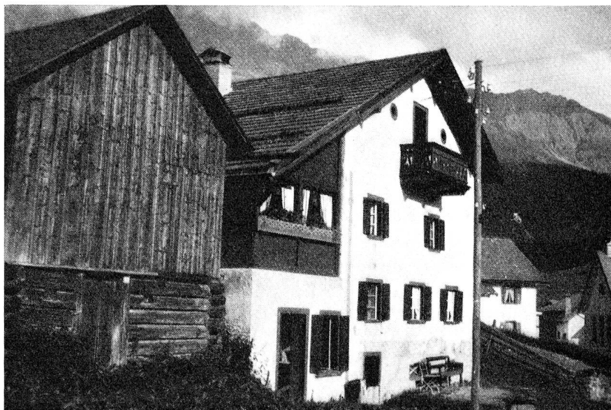
Geburtshaus von Leonhard Ragaz in Tamins

Gott Himmel und Erde» – bis zum letzten: «Komm, Herr Jesu!», und bei dieser ersten wirklichen Begegnung ist die Bibel ihm lebendig geworden. Er hat auch schon als Pfarrer zu St. Martin in Chur und in seiner ersten Basler Zeit als Pfarrer am dortigen Münster immer wieder Predigten gehalten, die durch ihren Gehalt an echt biblischer Wahrheit viele Menschen aufhören ließen. Aber erst während seiner Basler Jahre wurde ihm jene entscheidende Erkenntnis geschenkt. Was diese für ihn bedeutete, hat er selbst in seiner Autobiographie – unter der vielsagenden Überschrift «Das große Erlebnis» – ausgesprochen: «Da geschah die große Wendung: der Aufbruch des Glaubens an das Reich Gottes als Kern und Stern der Bibel und der Sache Christi. Diese Wendung war ein Wunder – es war ein Aufbrechen der mächtigen Gottesquelle mitten in der Wüste. Ich habe diesen Glauben an das Reich nicht von anderen übernommen, weder aus Büchern noch von Personen, nicht einmal unmittelbar aus der Bibel – er hat mir vielmehr die Bibel erst erschlossen. Er ist mir, als ureigenstes Erleben, unmittelbar von Gott gekommen. Ich habe ihn auch nicht, wie die Meinung ist, von Blumhardt übernommen, – von ihm wußte ich damals so gut wie nichts. Es ist das große