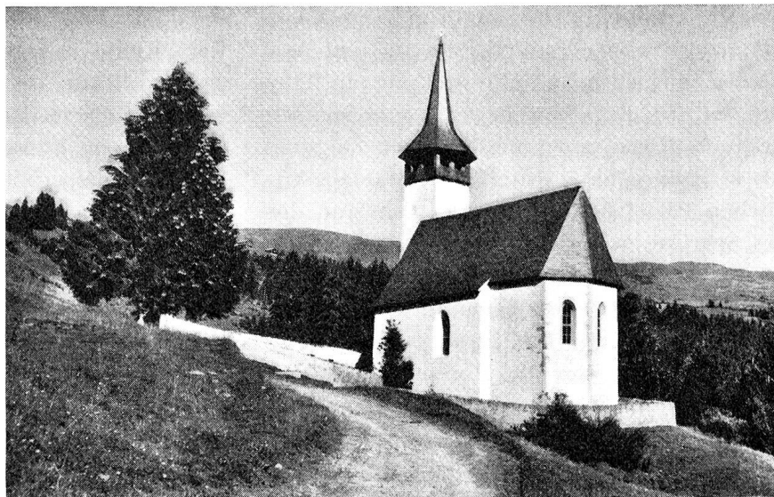
Das Kirchlein von Flerden, der ersten Pfarrei von Leonhard Ragaz

auch von Leonhard Ragaz gesagt werden: «Das Werden Gottes auf Erden, das Werden seines Willens bestimmte all sein Denken und Handeln.»