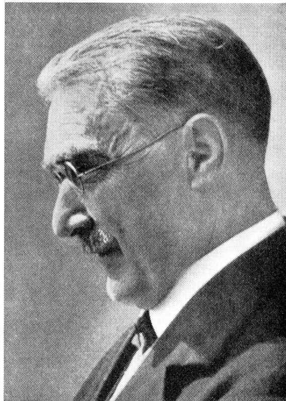
Leonhard Ragaz, Aufnahme aus seinen letzten Lebensjahren

In dieser Geschichte Gottes mit den Menschen fällt aber nach Ragazens Überzeugung auch dem Menschen eine wichtige Rolle zu: «Das Reich Gottes kommt durch die Kraft Gottes, aber es kommt auch durch die Menschen — durch die Zusammenarbeit Gottes und des Menschen.» Aller theologischen Verketzerung dieses Wortes zum Trotz, glaubte Ragaz an eine solche Mitarbeit. Der Mensch kann und soll das Schaffen des lebendigen Gottes in seiner Geschichte mit den Menschen sehen und verstehen; er kann und soll an das in der Bibel verheißene, in Jesus Christus offenbar gewordene Reich Gottes, dieses Vater-Reich, Kindes-Reich und Bruder-Reich, glauben und in solchem Glauben sich seinem Kommen handelnd und kämpfend zur Verfügung stellen. «Christen sind nicht in erster Linie Leute, die eine Weltanschauung zu ver-