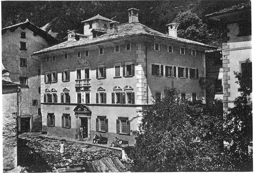
Hotel Willy, Soglio Palazzo Salis

ihm jeweilen erst ermöglichten, in neuer Umgebung zu verwurzeln.