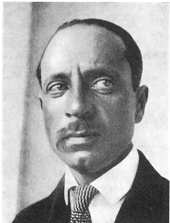
Rainer Maria Rilke

So intensiv der Dichter das Geschehen auch erlebte, so war es ihm seiner eigenen Natur nach nicht möglich, sich zu erheben. Alles, was er dagegen zu stellen vermochte, war sein Werk, von dem er wußte, daß es hier nicht entstehen konnte, hier, wo er zu intensiv von allem durchbrochen und im Innern zersetzt zu werden drohte. Er wußte, daß er der Stille und Einsamkeit bedurfte, wenn er das fortsetzen wollte, was vor dem Kriege begonnen worden war und noch immer da und dort als Gültiges aufklang — besonders in den wenigen Strophen, die er in dieser letzten Münchner Zeit schreiben konnte. Sie stehen an der Nahtstelle zwischen dem Eilenden, dem Treibenden der Gegenwart und dem immer Bestehenden, das groß ist, weil es der Stille gehört, in welche die Wandlung einmündet wie ein Gnadengeschenk: